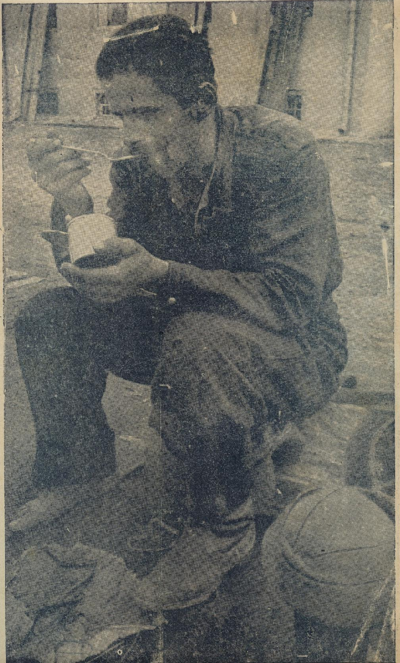
napora tež- ž b e putni orija . . . :