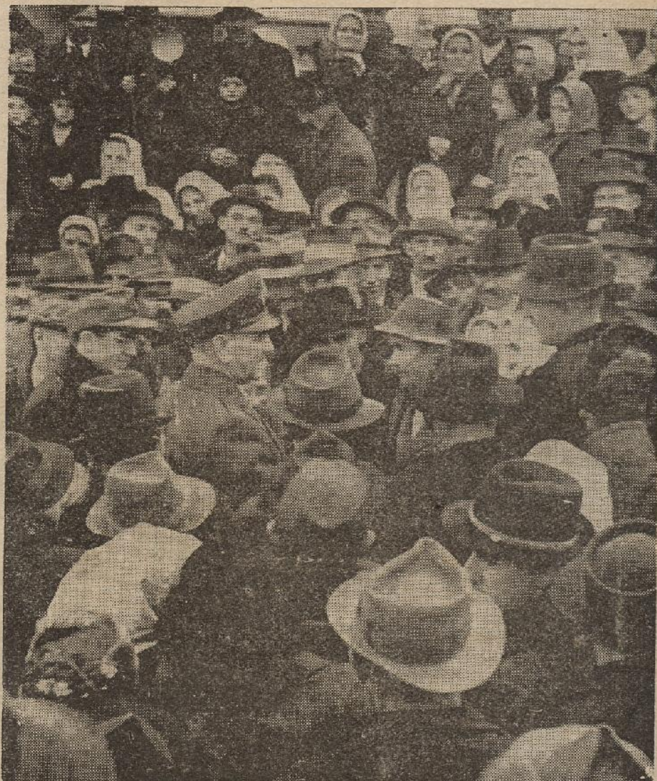
SNIMAK S POGLAVNIKOVA BORAVKA U HRVATSKOM ZAGORJU

»Da bi vladali našim krajem...« rekao je trenutno jedan klesičan Zagorac. A to bijaše rečeno iskreno kao u molitvi. Najveći nezadovoljnici i najljući borci »Za stare pravice« danas su potpuno smireni i zadovoljni »Poglavnikovom politikom«. I jedina im je želja, kako su Mu govorili, »da dojde mir Božji na Hrvatsku Državu i da Poglavnik bude naš Gospodar...«