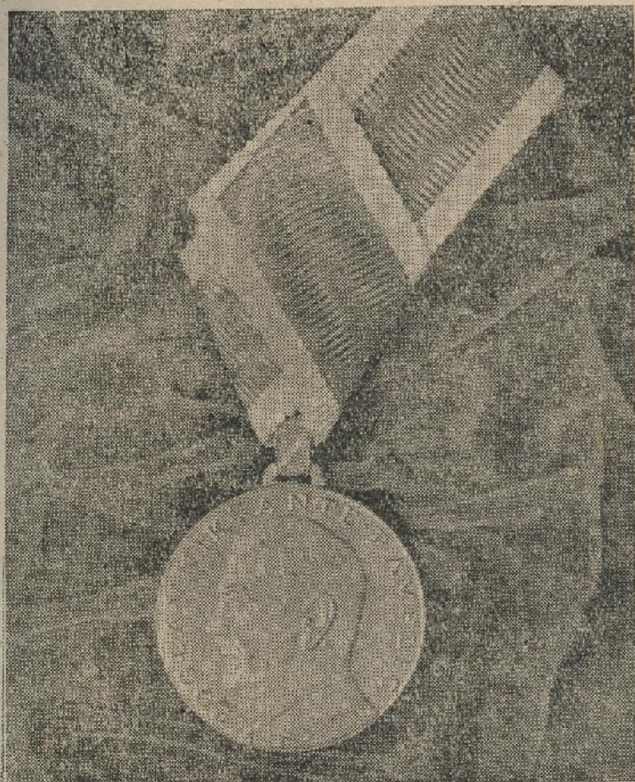
Ovaj znak resi samo poštene junačke grudi

Kad prodje vrijeme meteža i magle, koja je danas zastrla pameti, mnogi će požaliti što nije bio velik kao ovi junaci.