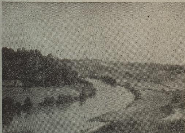
Motiv s Mrečnice