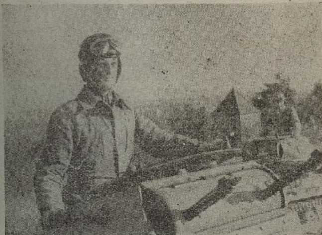
Na oklopljenim kolima

Borbe za granicu i nezavisnost Ustaške Hrvatske su od početka do kraja. Na Balkanu nije potrebno pisati priče o »hvalisavom vojniku«. Ovdje ljudi šute, a kugle pričaju.