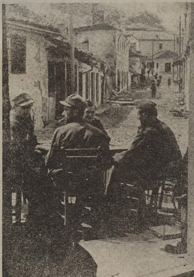
Odmor u uslobođenom gradu

Medjutim prije nego nam on izpriča doživljaj svojeg šest dnevnog svibanjskog dopusta, njemu za utjehu navest ćemo samo zadnju kriticu njegove pjesme, da vidite kako i junačine znađu pjesmice skladati: