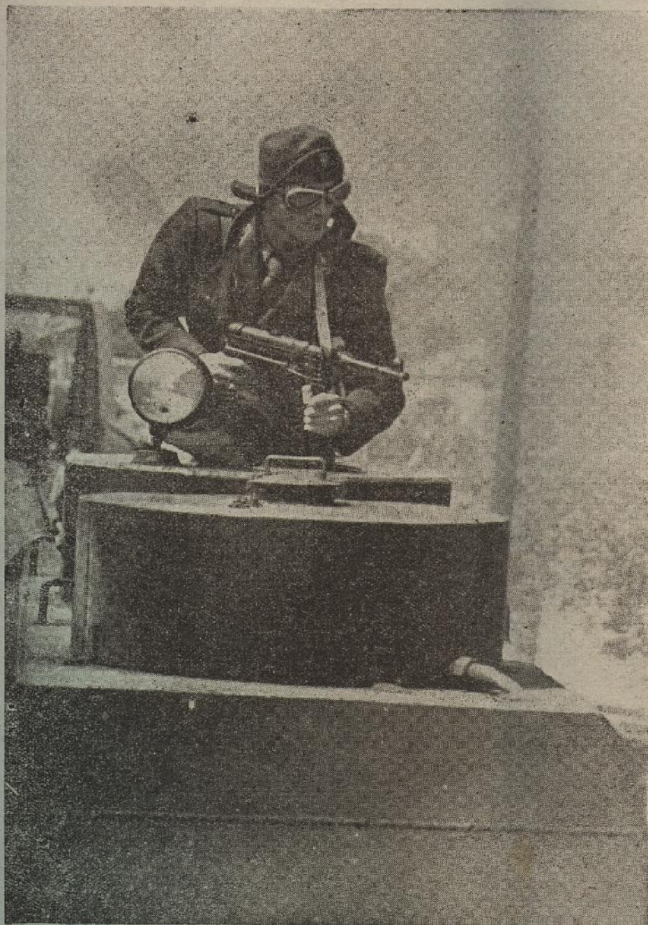
To znači biti ustaški »spreman«!