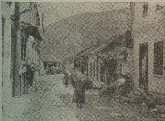
Mir se je vratio u selo pod gorom

U logoru Ilije Gregorića obavijen je svečani čin prisega domobranskih novaka, koji su počeli sa svojom redovnom vojnom izobrazbom. Na svečanosti iztakao je vojni dušobrižnik značajnu riečima važnost prisega podrievši da se tom prisegom zavjetujemo pred Bogom na vjernost Poglavniku i hrvatskoj zemlji. »Bog nam je darovao ovu zemlju, rekao je obavijeni da je branimo i čuvamo. Bog nam je u svojem zapovjedima naložio da ovu zemlju moramo ljubiti, a toj su se zapovjedi odazvali svi hrvatski sinovi tokom čitave svoje poviesti i branili je, gonjeni snagom svoje krvi, koja nikad nije mogla dopustiti, da se u hrvatskoj zemlji ugnieždi nepravda i tuđinska sila. Došli ste ova-mo da svojom prisegom prožmete i svoje drugarstvo, jer tom prisegom nosino i zavjet u svom srcu i misao na Boga i duh, kojim su tisuće hrvatskih sinova, u ovoj zakletvi živjeli i umirali.«