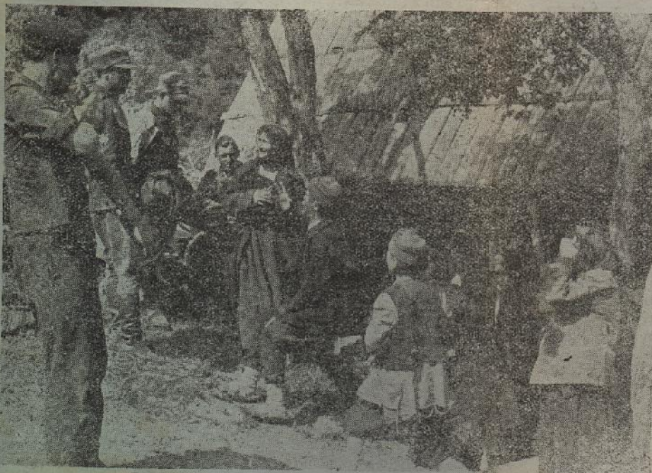
Vojnici su prvi sinovi naroda

Kad je osnovan ustaški pokret borbu čitavog hrvatskog naroda za oslobodjenje