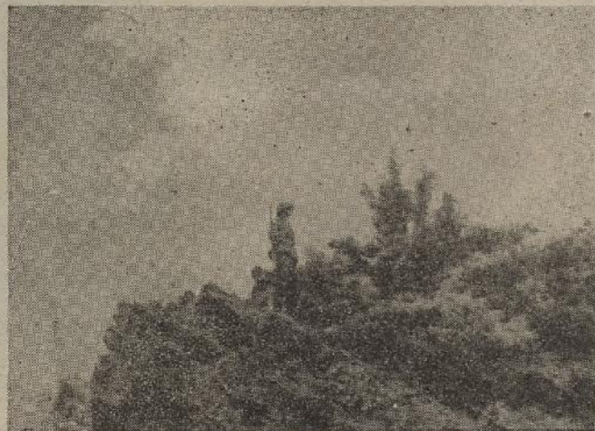
Oštrim pogledom promatra straža okoliš

Prosvjetnički vod odgojnog o- djela Minors-a kako bi svoj za- adatak izpunio što uspješnije bo- ravio je ovih dana na terenu,