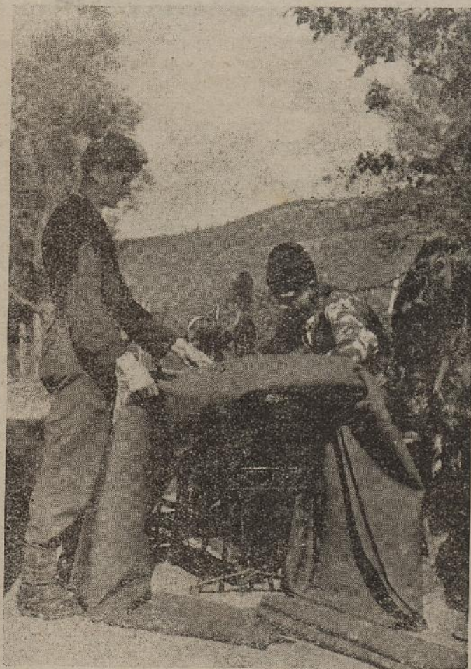
Krojači u prirodi

Hvala Bogu dragome, sviće liepa zora, pucnjava prestaje. Na sreću oni se povlače posve i u četiti sata u jutro na da-