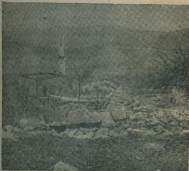
Tragovi pljačke i zločinstva

»Ostajte ovdje, sunce tuđjeg neba ne će vas grijati ko što ovo grije...«