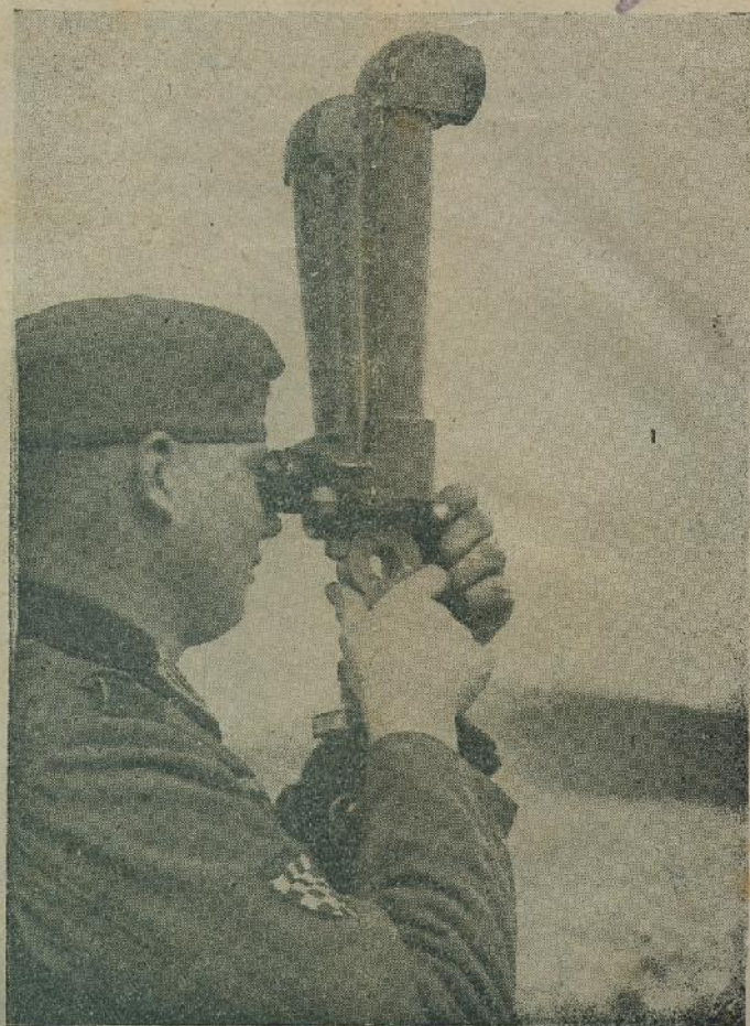
Prematranje neprijateljskih postava

U jednom selu smo se za- držali 12 dana i tu smo dobili dopunu. Sve su satnije bile podpune. Jednog dana u deset sati nam dodje dojavnik na ko- nju i javi da odmah moramo ići nazad, jer krećemo za Sta- ljingrad. Drago nam je bilo kad smo čuli, da će i hrvatski legionari učestvovati na Sta- ljingradu, jer bi nam bilo kri- vo, da nam izmakne takova borba. Još smo se zadržali u jednom selu, gdje smo dobili hrvatska odlikovanja. Tu nas je posjetio i naš junački Po- glavnik i od njega smo dobili mnoga odlikovanja. Svi smo bili uzbudjeni i neopisivo ve- seli kad smo ga vidjeli.