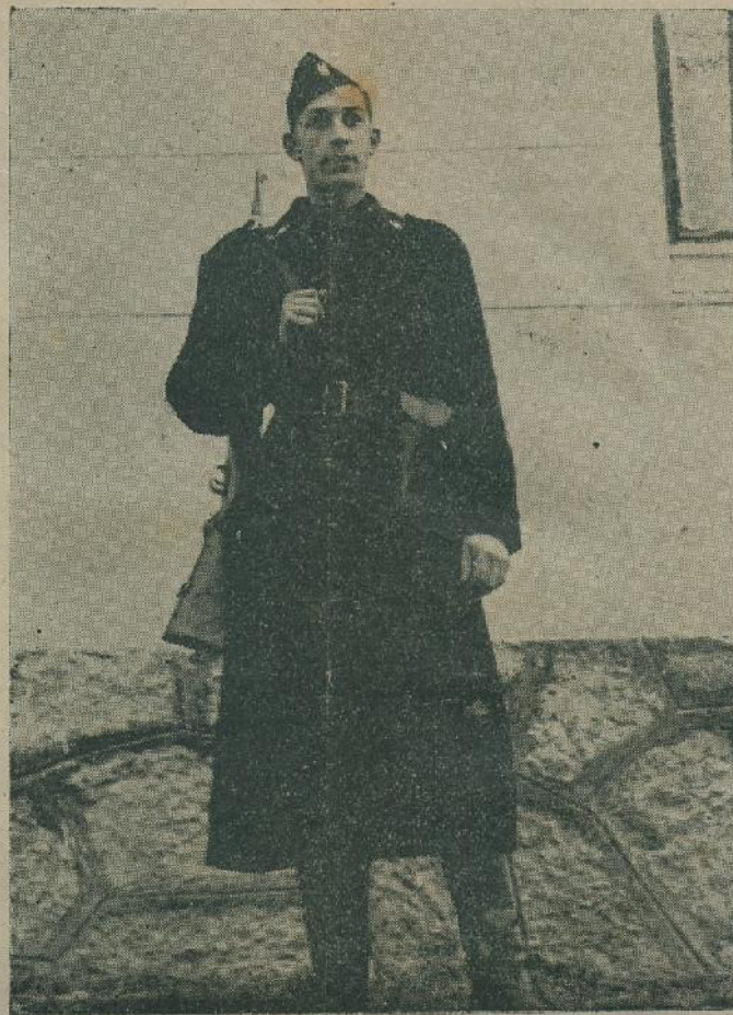
Jedan od mnogih s Drine

Tako smo i mi dočekali ono, što smo toliko željeli, postali smo branitelji naše hrvatske grude, koju ćemo i nadalje čuvati i braniti gdje god se pojavi ne-