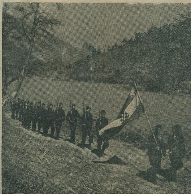
Ustaše prolaze obalom Drine