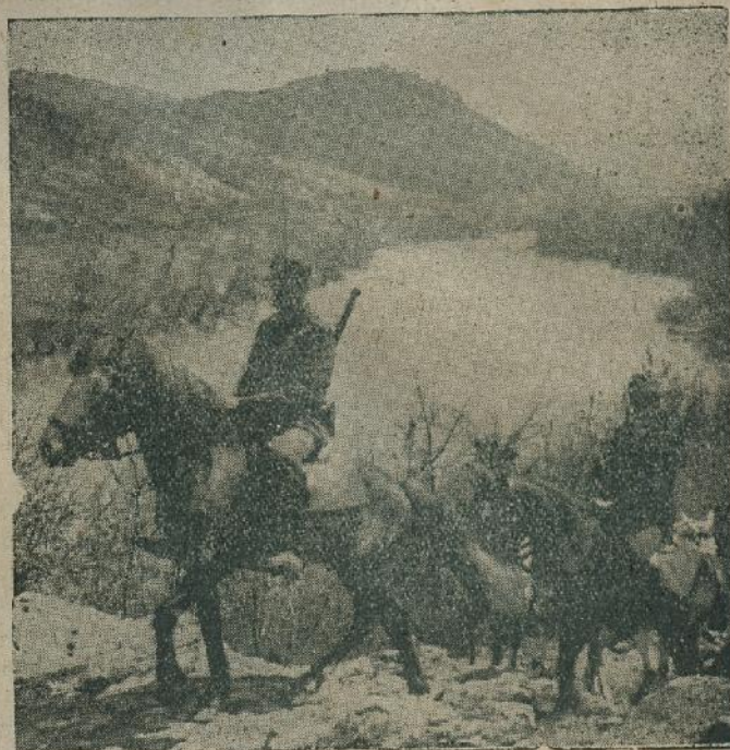
Stražarska ophodnja na Drini

U isto vrijeme, dok kroz poviest krvarimo na doma-