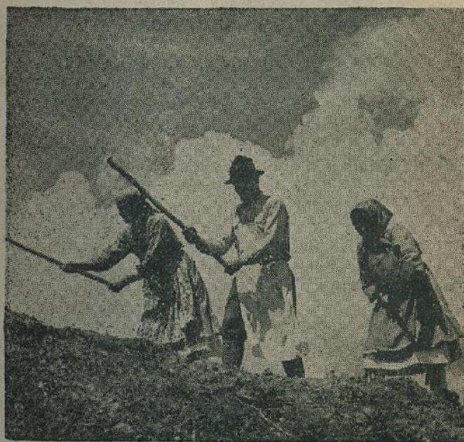
Proletni rad na polju

Može se reći da su stranci u Hrvatskoj uspjeli svojim upravljanjem osakatiti i spriječiti prirodni razvitak porasta pučanstva i pridizanje narodnog života, da su sa hrvatskih ognjišta uspjeli utrnuti vatru svakom šestom ili sedmom Hrvat, tako da danas izvan granica naše države ima preko dva milijuna hrvatskog izseljeničtva i hrvatskih izseljeničkih skupina. I to po svim kontinentima, svim državnim prostorima ogromnih daljina, uz sva mora i u svim klimatskim pojasima. U isto to vrijeme, dok su se starosjedioci Hrvati otisnuli preko dalekih mora u tuđi nepoznati svijet, da tako svoju snagu i svoje živote poklone rudnicima i najopasnijim predjelima još nekultiviranih zemalja, u domovini na napuštene domove pala je sva sila doklaćenih tudjinaca najraznovrstnijih mješavina, najneplemenitije krvi i roda. Ovi će od sada stalno ugrožavati hrvatske granice, kao i unutrašnjost, iztičući se i suprotstavljajući se uvijek hrvatskim interesima i volji hrvatskog naroda. Bježanje naših ljudi u tuđi svijet, osobito u Ameriku, a nadiranje stranaca sa svih strana u Hrvatsku, ponavljalo se je bez pre-