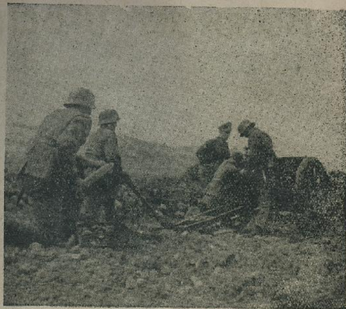
Topnici se pripremaju

Po prvi puta u poviesti dogodilo se je i to, da su se hrvatske snage i hrvatske žrtve usmjerile u istinu pravim putem k pobjedi. To je u prvom redu zasluga željezne Poglavnikove ruke, kao i njegovih dalekovidnih političkih smjernica. Od onda do danas hrvatska krv i narodne snage troše se samo za dobro domovine. To ne smijemo smetnuti s uma osobito danas, kada nas Nezavisna Država Hrvatska poziva da pojačamo još više svoj rad, kako bi se prije približili žudjenom miru.