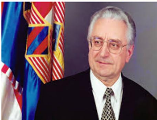
HKV Dr. Franjo Tuđman: Moramo razvijati ...

http://www.safaric-safaric.si/zds@@@/Zzx_POVEZNICE.htm