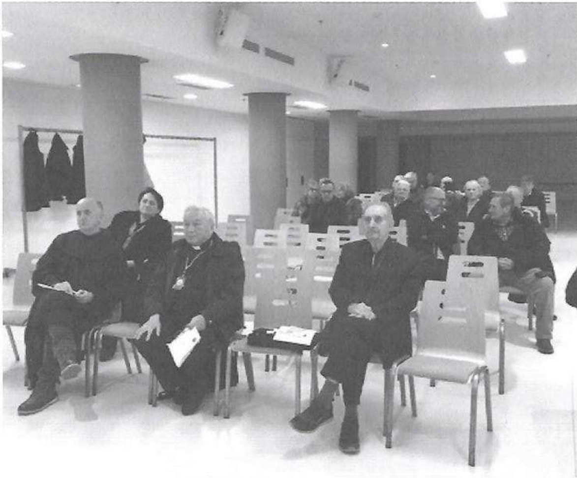
Nastavak rada u mirnom i demokratskom ozračju

Navodi glavne smjernice rada za iduću godinu: