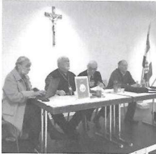
Radno predsjedništvo Sabora

Znam, imam i dokaze, da se UDB-a bavila mojom osobom prije šezdeset i nešto godina, i da me je otpremila na Goli otok. To je bila jedina moja „suradnja s UDB-om“, a uporište za optužbu da potkradam udrugu vidim u jednoj zgodi,