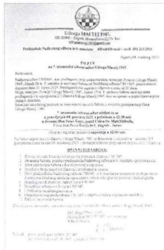
Pozivnica za Sabor