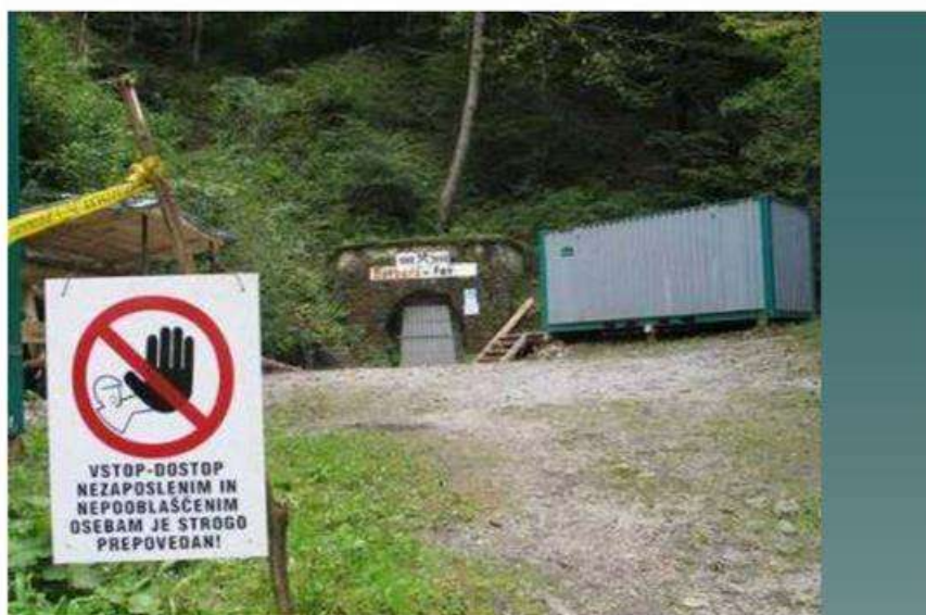
Laško - Spodnja rečica 23.10.2008. g. : radovi na otvaranju Barbarinog rova su zaustavljeni