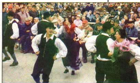
Graška Gora je kljub neprilaznemu vremenu privabila veliko ljudi.

20011115_Nas_Cas_Poslanski_Večer_Bojana_Kontica_gost_Stanovnik.docm