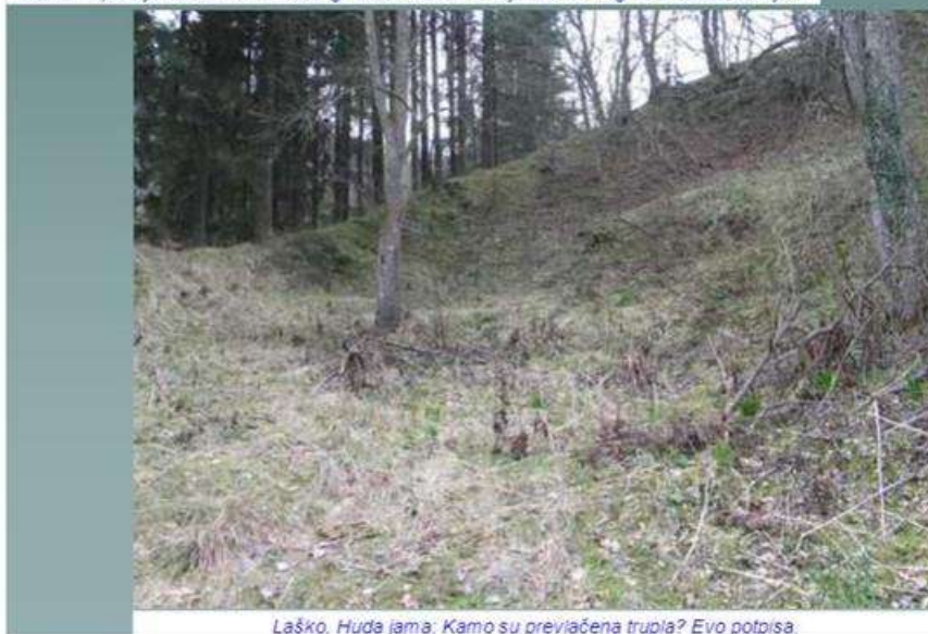
Laško, Huda jama: Kamo su previačena trupla? Evo potpisa