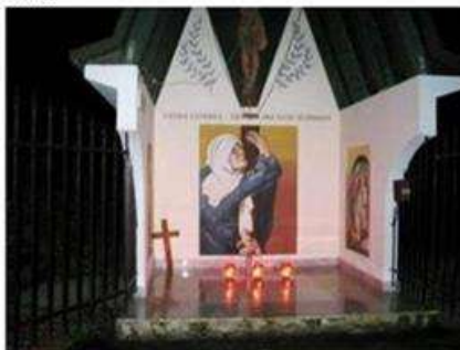
Permeova kapelica, izgrađena 1997., na dan Svih svetih 2008. godine

Dajte, molim Vas. Ništa oni nisu otkrili, samo su odavno otkriveno stvarno otvorili pod našim pritiskom i ponešto od toga javnosti objavili. Pogledajte samo s kakvim je brojkama, hrapro, slovensko društvo izašlo pred vlasti davne 1996. godine, kada je tražio dozvolu za postavljanje spomen kapelice. Spominje se 10 do 15 hiljada žrtava!