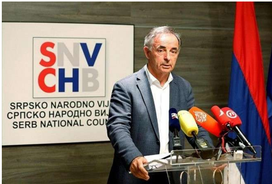
SAVJET ZA NACIONALNE MANJINE mandatno razdoblje 2019.-2023.