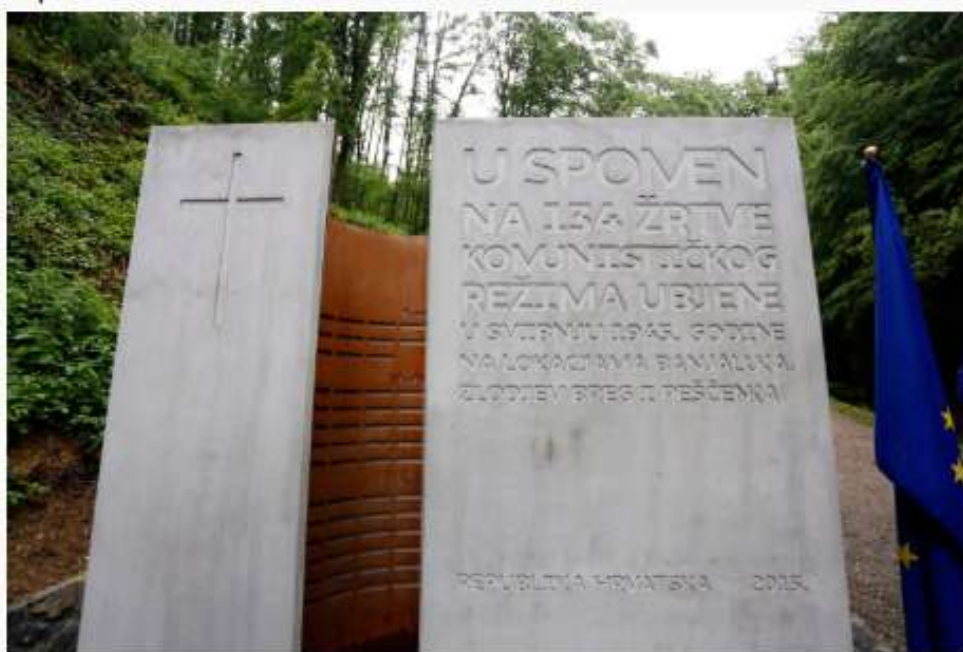
(Na fotografiji: Spomen obilježje žrtvama komunističkog režima Gračani – Banja Luka postavljenog u sjećanje na žrtve iz triju masovnih grobnica iz svibnja 1945. godine.)

startu ublažiti, i imao je veliku podršku u Vladi. No, uspio sam ipak nekako pridobiti zastupnike, nagovarajući, i taj zakon je prošao. Osnovan je Ured, ja sam bio predsjednik upravnog vijeća, volonterski, jer sam htio pokazati da se ti poslovi moraju raditi sa srcem, ne zbog novca”. Zatim je naglasio kako je oformljena izvanredna ekipa stručnjaka i znanstvenika, međutim Ured je izdržao svega godinu dana, “što je apsolutno prekratko vrijeme da se uspostavi funkcioniranje takvog Ureda koji je imao samo dva zaposlena”.