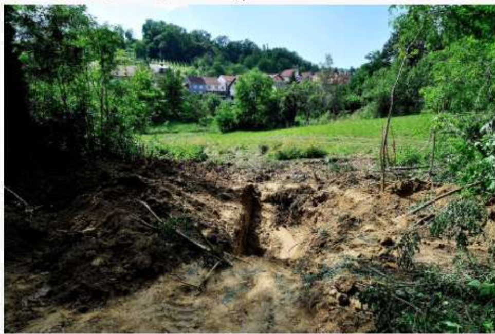
(Na fotografiji: Lokalitet masovne grobnice iz Drugog svjetskog rata na području Gračana)

iskapanja žrtava Drugog svjetskog rata obavljati Ministarstvo hrvatskih branitelja. “Naravno, to nema nikakve veze s 1945., ali je znao da će Tomo Medved lukavo zakočiti istraživanja”, smatra bivši visoki član HDZ-a. “ Tomi Medvedu je povjeren zadatak za ta iskopavanja, a nije otkopao niti jedan promil svih tih grobova, čije popise i lokacije je našao u dokumentaciji našeg Ureda. Dakle, tu i tamo se otkopa nešto malo pred izbore ili prigodno, ali to apsolutno nije sustavni posao. Pa i ovo sada što je potaknulo da se pokrene ta priča (dvije masovne grobnice u Svetoj Nedelji u kojima je pronađeno 48 posmrtnih ostataka komunističkih žrtava, op. a.), to je jedan mali lokalitet koji je beznačajan sam za sebe, ali u sklopu ogromnog zločina kojeg su počinili komunisti nakon Drugog svjetskog rata”, rekao je Hebrang.