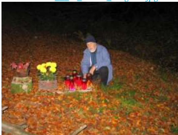
20151101-12 Sostanj Gorica SI SVETI.jpg