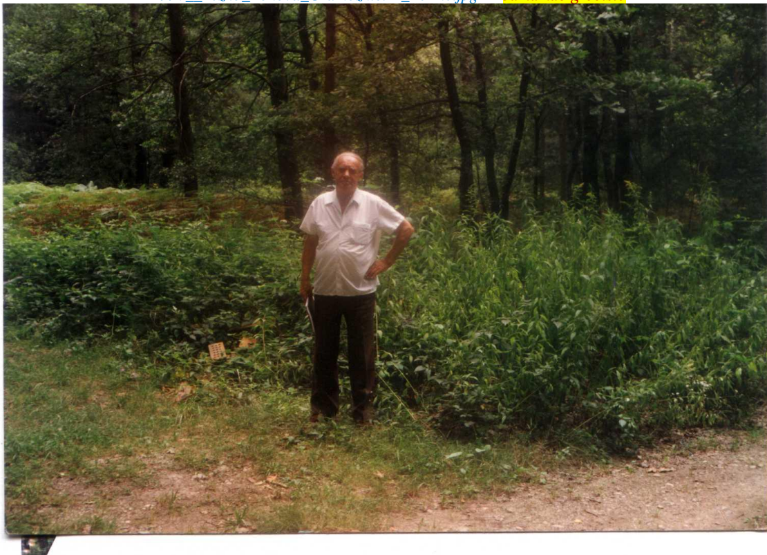
1990__Tezno_Bohova_Gramoznici-2_Perme.jpg Jama kao grobište

Tudi Koželj skriva množične grobove žrtev iz Teharij, med njimi so tudi Velenjčani. O tem več kdaj drugič.