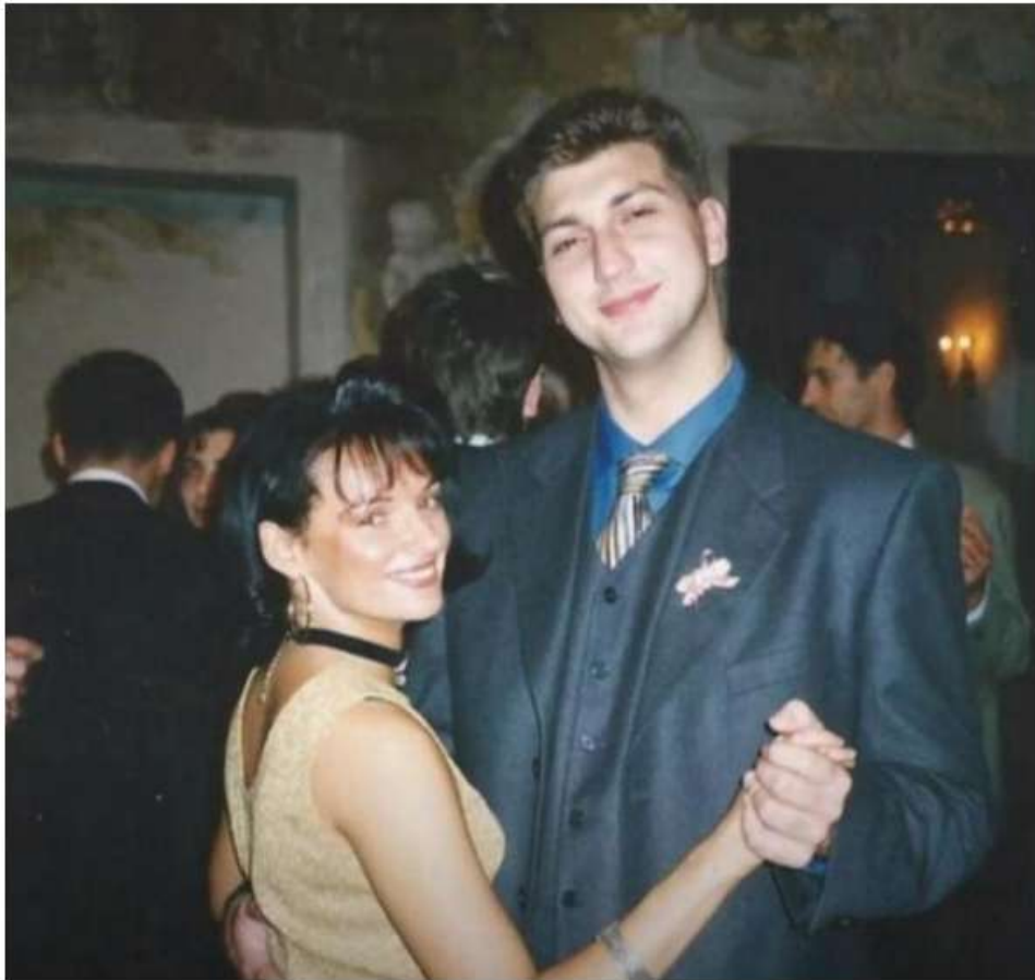
mr. sc. Andrej Plenković, predsjednik Vlade Republike Hrvatske: „Dragune, ponavljam, ne diraj u Boljševike!“