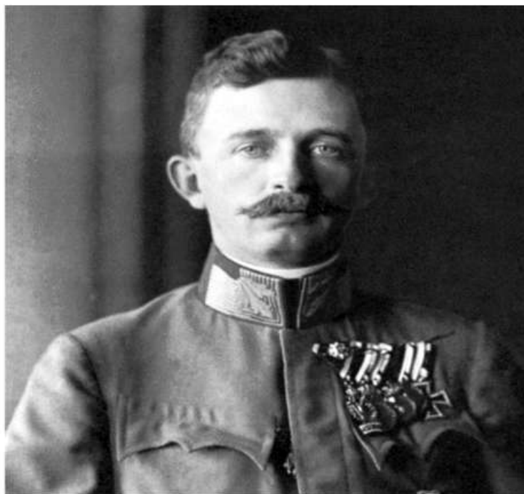
Car i kralj Karlo I/IV

Smotra za demokratske Hrvate i njihove prijatelje