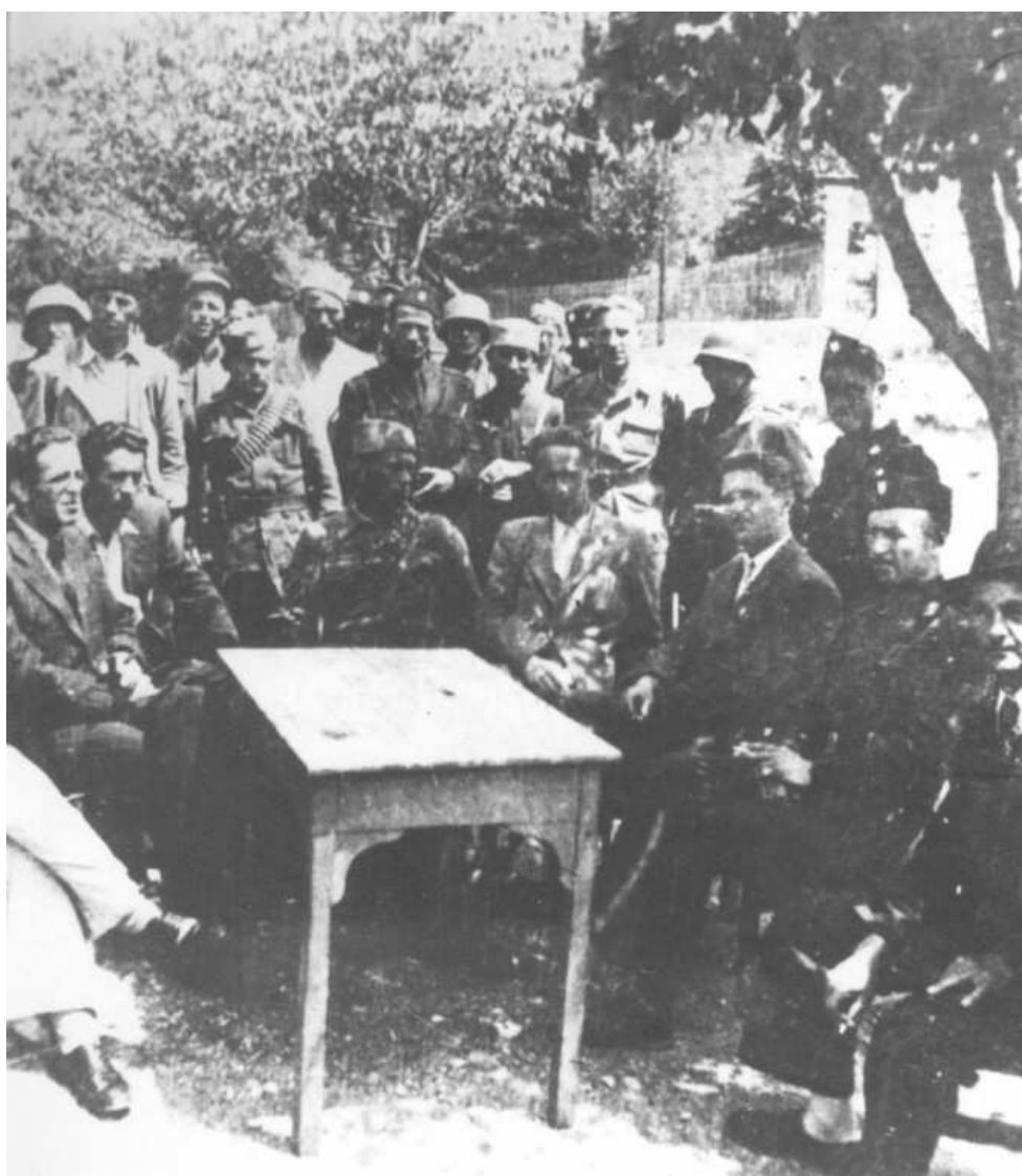
Četnici, ustaše i domobrani u Bosni.

Sutradan, stiže pojašnjenje: “Ustaše dižu glavu u Bosni, ali znajte da ima dve vrste ustaša. Samo su idejne ustaše naši neprijatelji, a ostali predstavljaju miliciju, koja je sa nama u saradnji“.