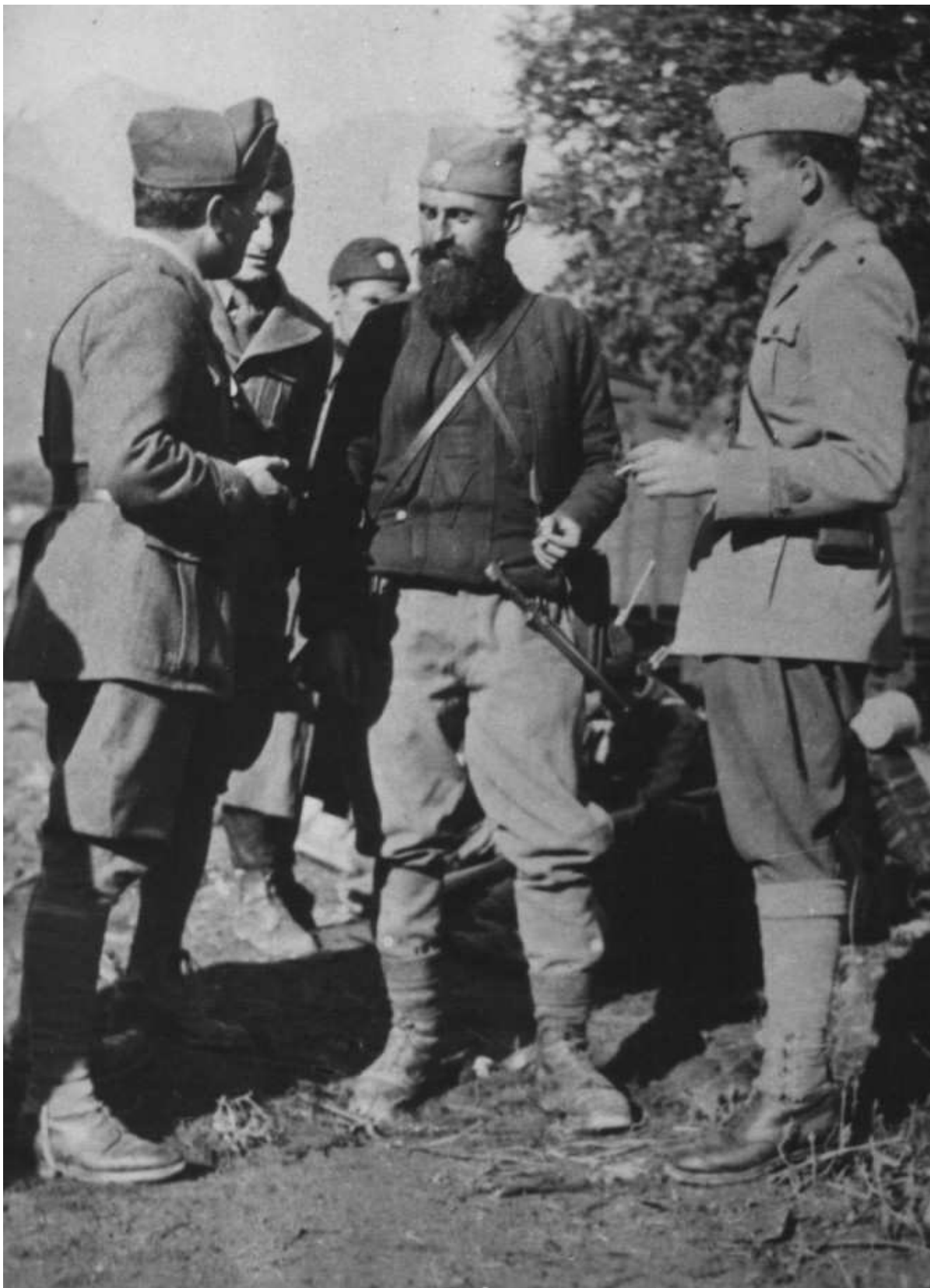
Četnici i Italijani u Jablanici u Hercegovini 2. oktobra 1942.

Pod plaštom zaštite Srba od ustaškog noža, četnici postaju de facto i de jure deo italijanske okupacione sile koja je između ostalog i saveznik tih istih ustaša koje kolju Srbe po jamama i logorima. I jedni i drugi nalaze se u Antikomunističkog dobrovoljačkoj miliciji.