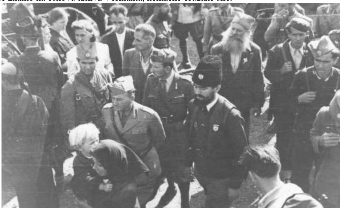
Četnički vojvoda Momčilo Đujić sa Italijanima i četnicima.

Najbitniji događaj, međutim, svakako je sastanak u Topoli 11. avgusta 1944. godine o kome najviše znamo na osnovu arhiva Vermahta, nemačke oružane sile.