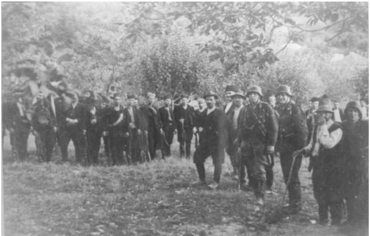
Nemci vrše smotru četnika negde u Srbiji.

Veliki broj njih zajedno je sa hrvatskim nacionalistima stradao na Blajburgu, a mnogi i pre Blajburga.