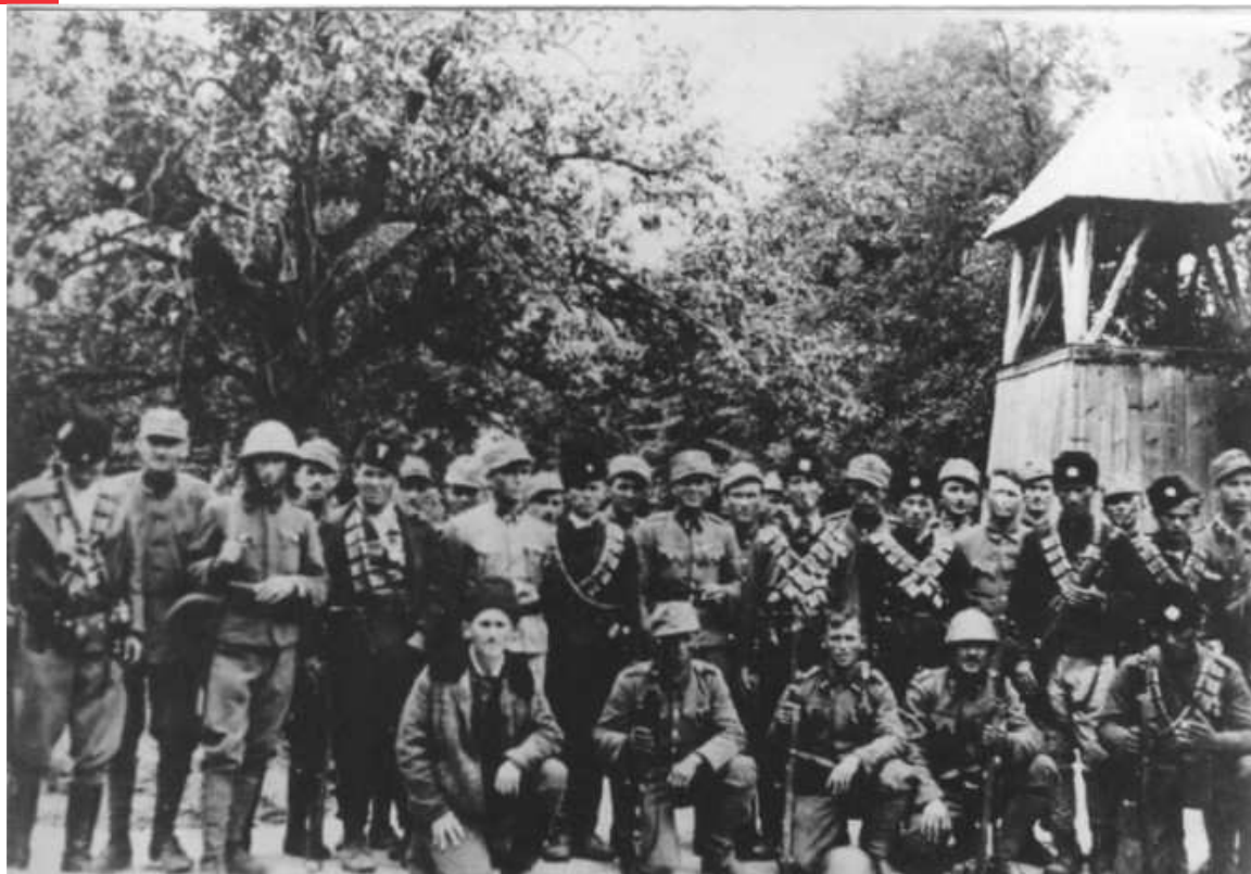
Četnici i domobrani.

Hitler odbija punu saradnju, ali dozvoljava ograničenu, pa tako četnici iz magazina Vermahta dobijaju 11.000 pušaka i pet miliona metaka a ogroman broj nemačkih komandanata sklapa dogovore sa Dražinim snagama. 6. septembra pod njegovu komandu dolazi i kvislinška Srpska državna straža.