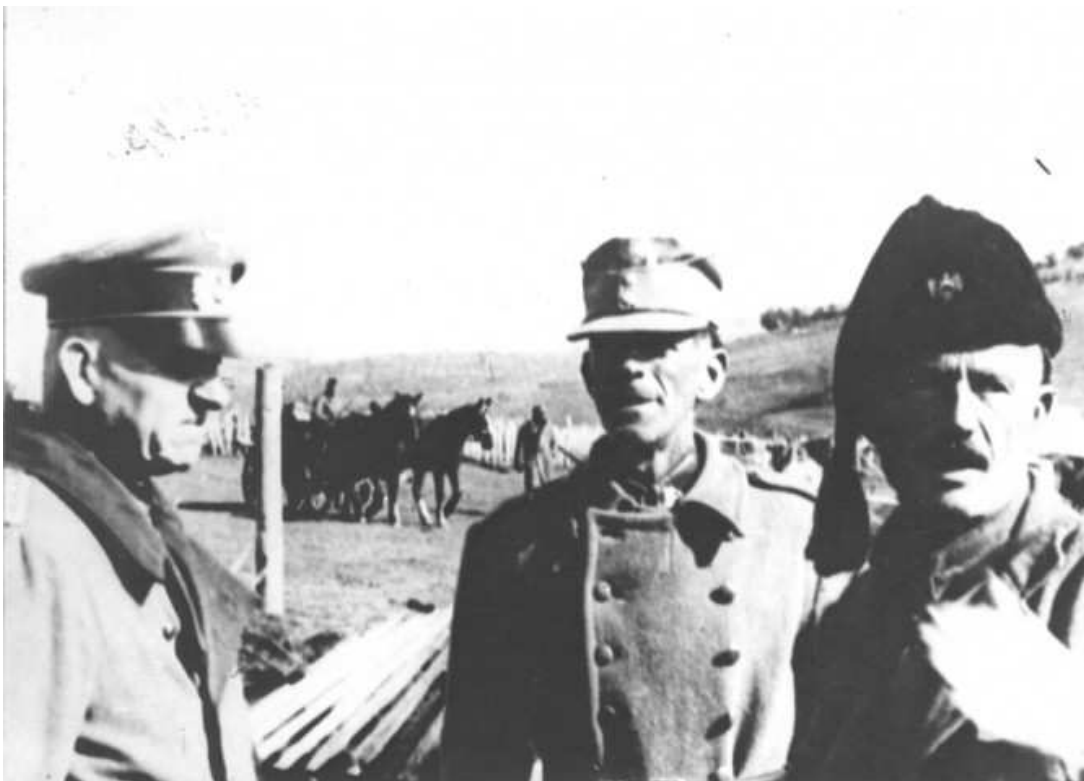
Četnički vojvoda Rade Radić sa nemačkim generalom Štalom i nepoznatim domobranom tokom IV neprijateljske ofanzive 1943. godine.

Ona je počela još u Divcima novembra 1941. godine, kada je Draža ponudio nacistima saradnju u brisanju partizana ( nemački transkript sa tog sastanka možete pročitati ovde ), kada je objasnio da je komunistički ustanak nekoliko meseci ranije morao da podrži jer bi ga njegovi ljudi napustili da nije.