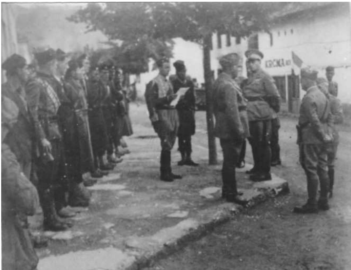
Četnici na smotri pred italijanskim guvernerom Crne Gore Pircijem Birolijem. Foto: Naravno, ako vam je brat sa kojim ne delite isto političko mišljenje veći neprijatelj od stranca koji je došao da vam siluje zemlju, ovaj tekst vam neće značiti ništa.