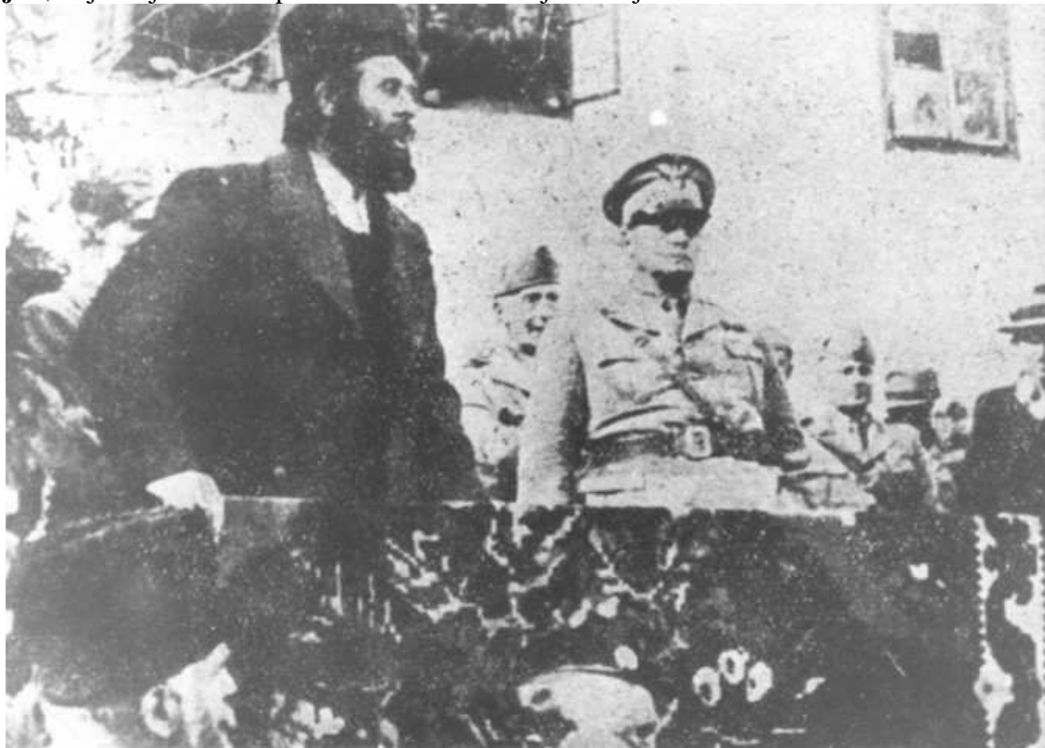
Vojvoda Pavle Đurišić drži govor u Kolašinu u prisustvu guvernera Crne Gore Pircija Birolija.

Srbija u kojoj partizana gotovo i da nema pošto se svi bore na teritoriji NDH, Srbija u kojoj dominiraju četnici, potpuno je mirna . Toliko mirna da Nojbaher piše kako je avgusta 1944. godine “ u njoj bila stacionirana samo jedna nemačka borbeno jedinica i to jedan policijski bataljon , koji i nije bio kompletan u odnosu na brojno stanje”.