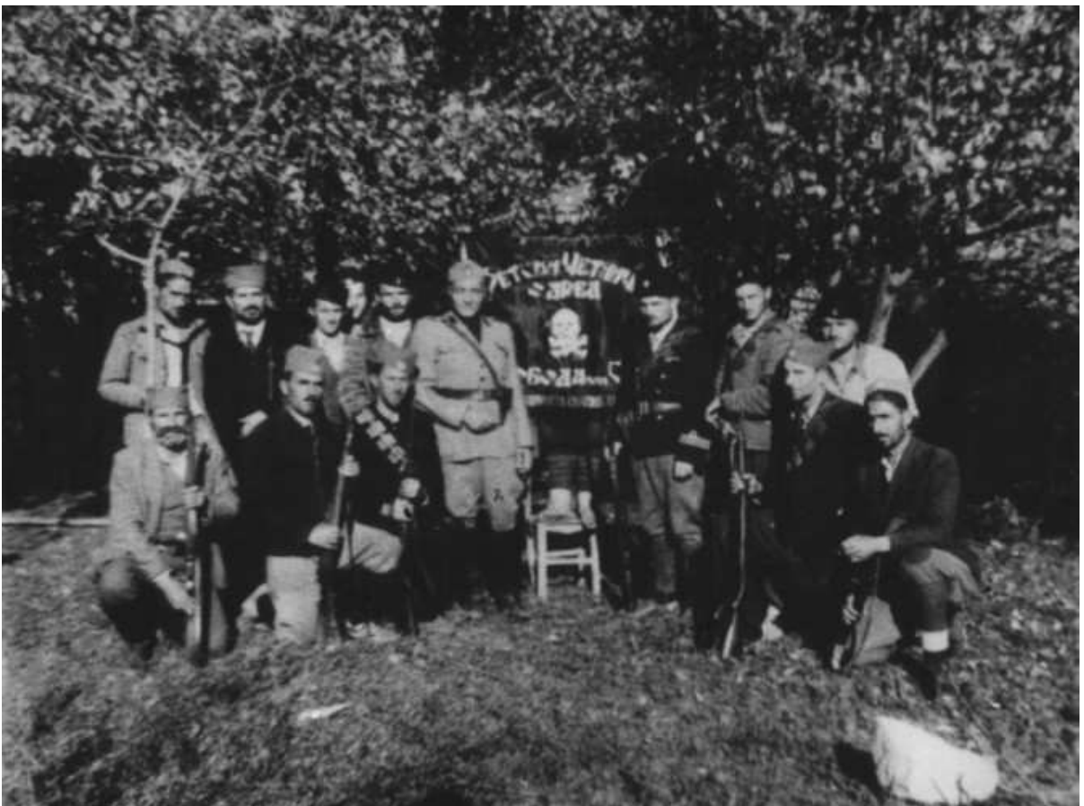
Zetski četnički odred i Italijani u leto 1942. godine.

Na istom prostoru, posle sloma Italije i dolaska Nemaca i u tu zonu, četnici se i dalje slobodno kreću po Splitu pa se čak i pismeno žale vlastima da ih ustaše pljuju na ulici.