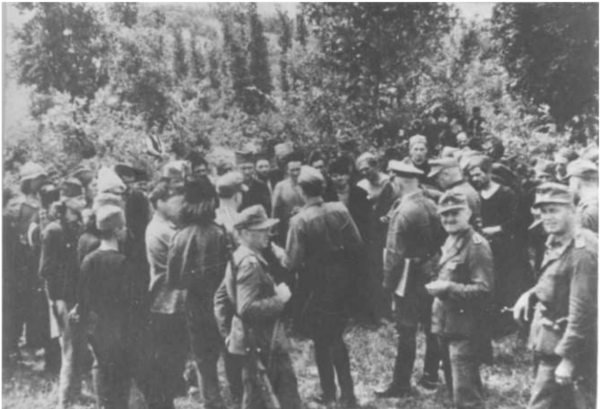
Četnici i Nemci.

Veliki broj njih zajedno je sa hrvatskim nacionalistima stradao na Blajburgu, a mnogi i pre Blajburga.