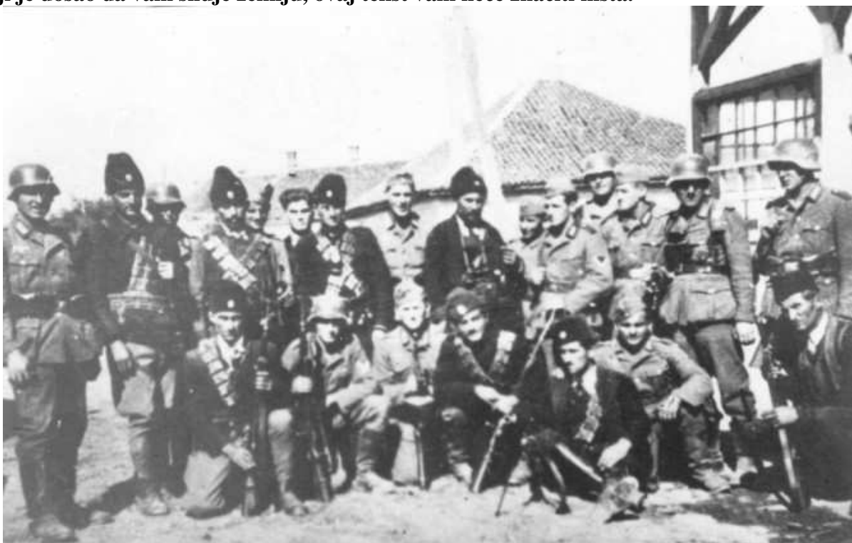
Četnici i Nemci u Srbiji na jesen 1941. Da li će vam, međutim, značiti dokument koji prilažemo za sam kraj ovog teksta, u kome četnici 2. avgusta 1943, na Ilindan, obavestavaju ustaše u Mrkonjić Gradu da se u Vrbljanima kod Crkve održava partizanski zbor, i u kome traže da se oni tamo bombarduju?