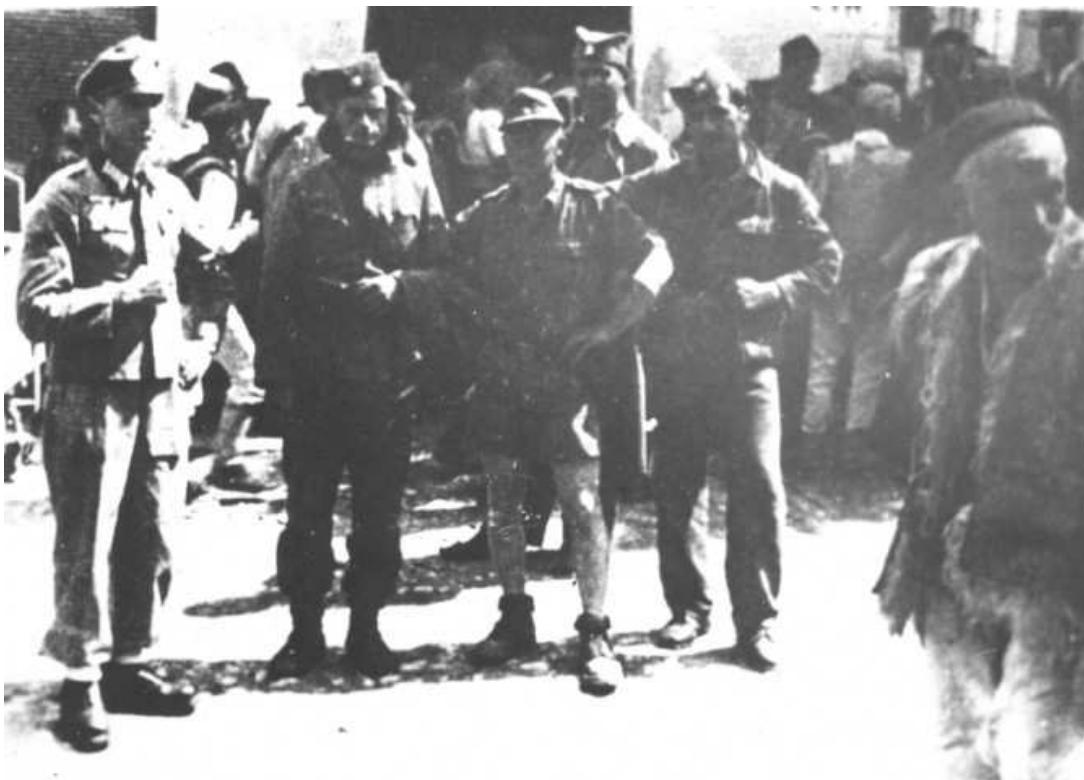
Četnici i Nemci za vreme Pete neprijateljske ofanzive u Hercegovini 1943. Foto:

Nešto tajnija bila je “legalizacija” kod Nemaca u samoj Srbiji, ali je i nje bilo u velikoj meri.