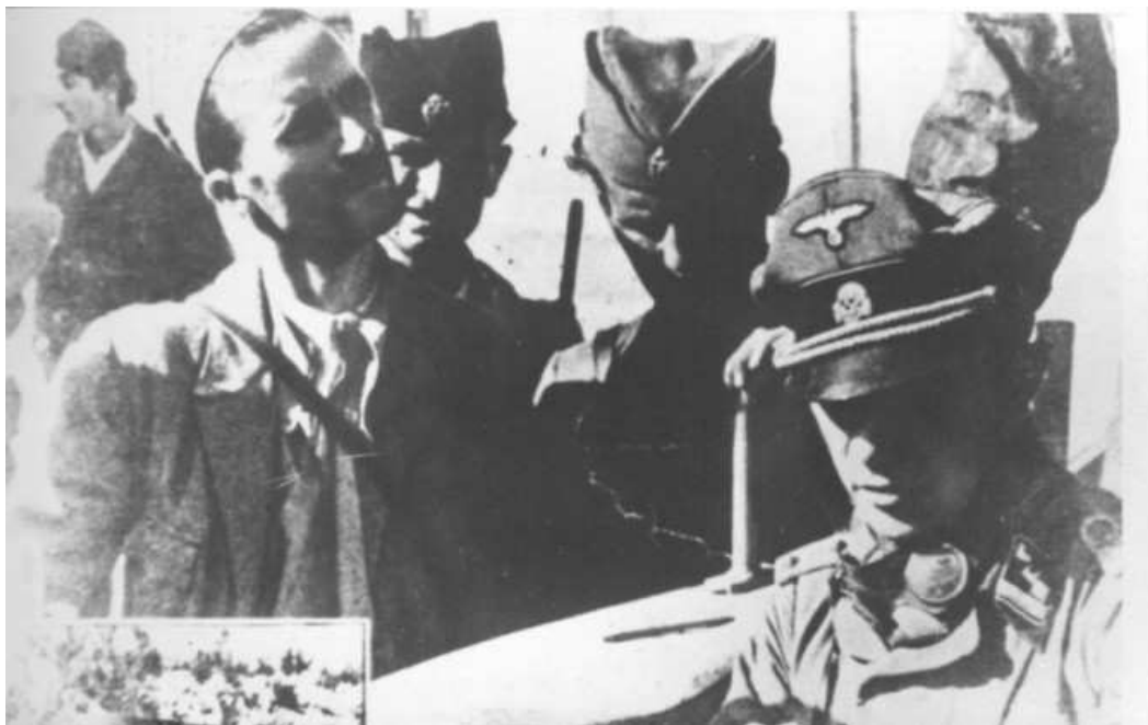
Hercegovački četnici i nepoznati nemački oficir.

Sutradan, stiže pojašnjenje: “Ustaše dižu glavu u Bosni, ali znajte da ima dve vrste ustaša. Samo su idejne ustaše naši neprijatelji, a ostali predstavljaju miliciju, koja je sa nama u saradnji“.