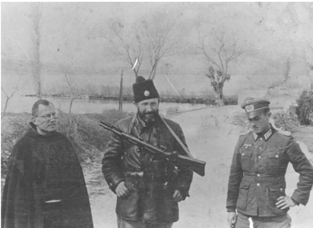
Nemački oficir, četnički komandant i ustaški gvardijan u Karinu kod Obrovca krajem 1943.