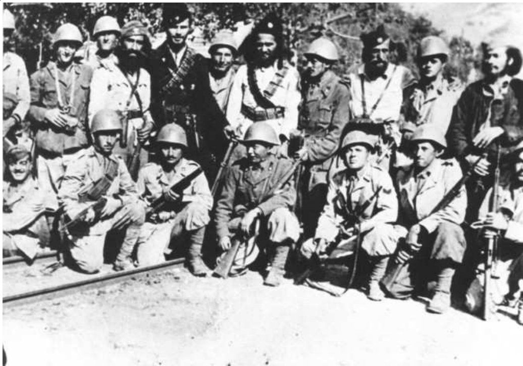
Italijani i četnici u Jablanici 1943. godine.

1) da Draža lično ostane u ilegali , odnosno da se on personalno ne ističe kao neko ko podržava dogovor a sve zbog posleratnog političkog delovanja, kako ne bi bio kompromitovan među srpskim narodom, i