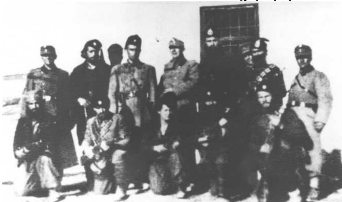
Četnici i nemački vojnici tokom pokušaja partizanskog proboja u Srbiju u proleće 1944.

Nakon oslobođenja Srbije, četnici se na čelu sa Dragoljubom Mihailovićem povlače u Bosnu zajedno sa Nemicima, odakle 7. februara 1945. godine Draža depešom daje instrukcije svojim ljudima sledeće sadržine: “Sa ustašama u Gračanici održavati najprijateljskije veze”.