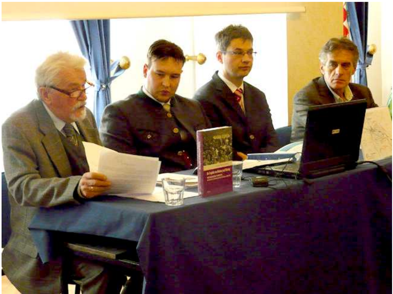
Kliknite za veći format fotografije ! ( Predstavljanje knjige 25. listopad 2011. - Europski dom u Zagrebu )