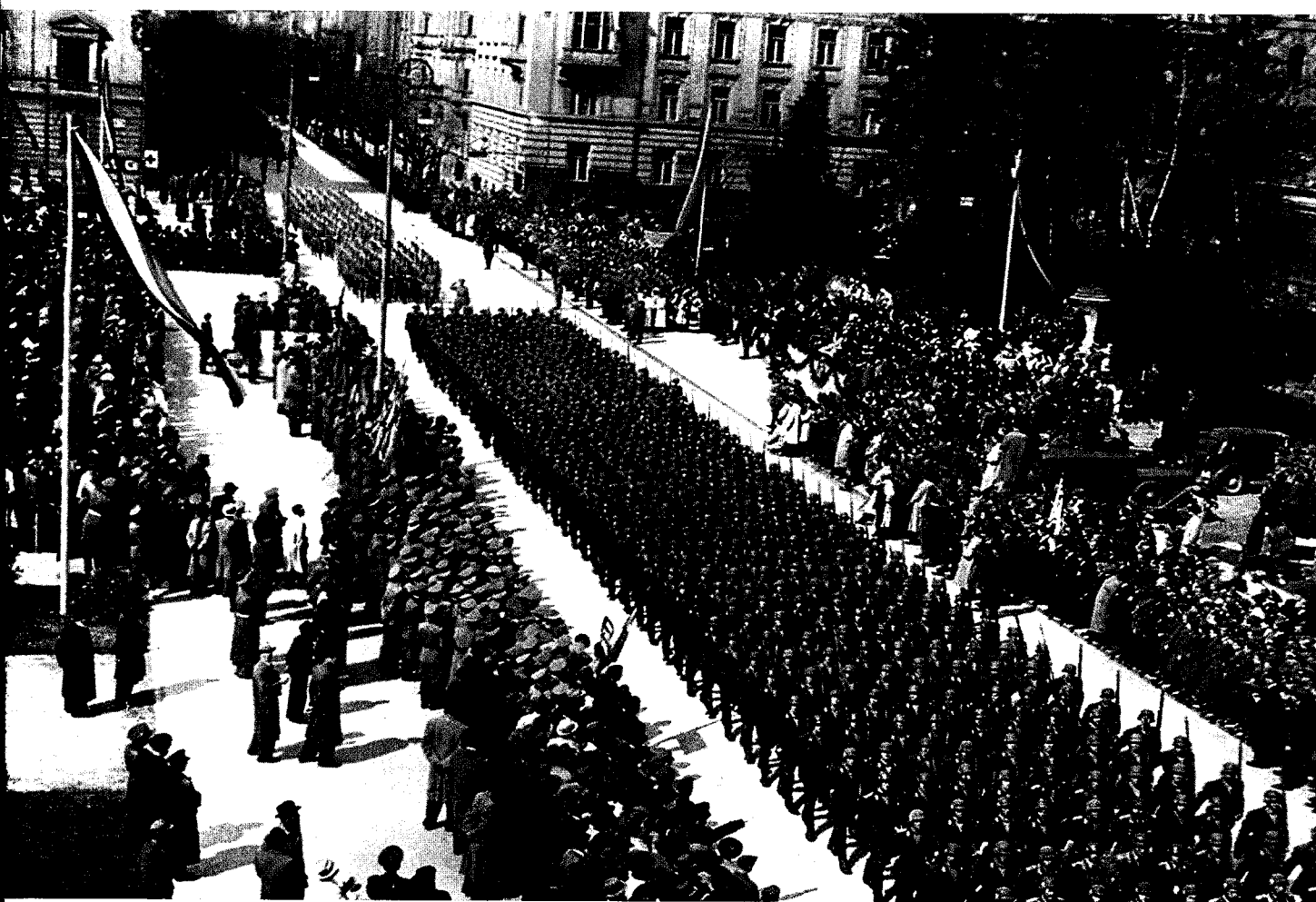
Svečani mimohod prvog naraštaja dočasnika ustaške vojnice pred Antom Pavelićem 10. travnja 1942.