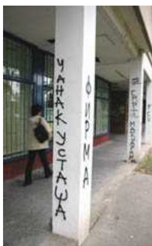
Újvidék, "Telep" - "Csanak egy Usztasa"(?) "halál a magyarokra"