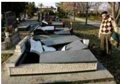
Zenta - Római Katolikus temető