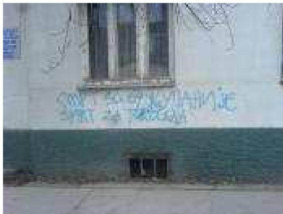
Szerb falfirka Temerinben: Halál a 64 Vármegyére, halál Toroczkaira!