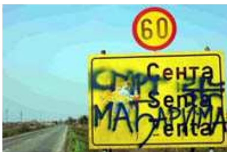
Zenta - Halál a magyarokra