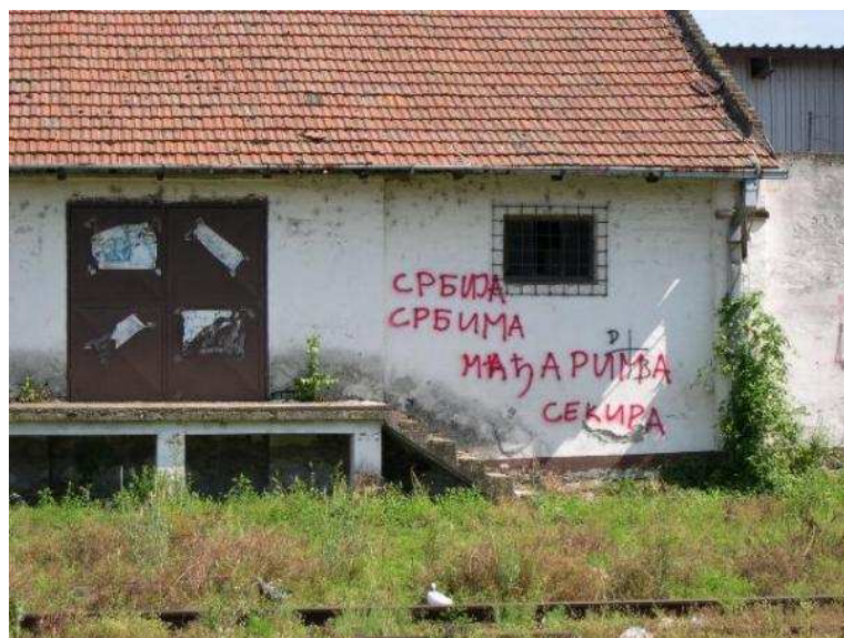
Temerin, Vasút utca - "A szerbeknek Szerbiát, magyaroknak kisbaltát"