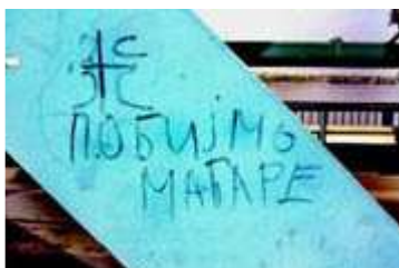
"Lemészároljuk a magyarokat"