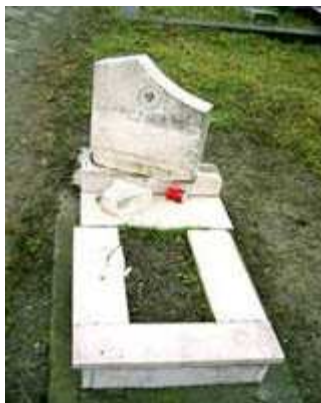
Újvidék - Római Katolikus temető - Kalapácsokkal rongálták meg egy ötéves kislány síremlékét.