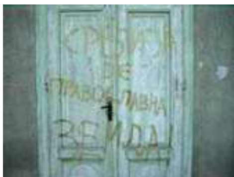
Zombor - Református templom ajtaja: "Srbija je pravoslavna zemlja" vagyis "Szerbia egy pravoszláv állam"