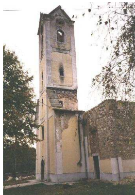
Slunj crkva Presvetog Trojstva

Crkva je sagradjena 1726. Spomenik kulture. Pripadnici pobunjenih Srba i Jugoslavenske narodne armije crkvu su zapalili, 30.11.1991. U požaru je, uz njen inventar, potpuno unisten i inventar iz zupne crkve u Dreznik Gradu, koji je tu bio sklonjen.