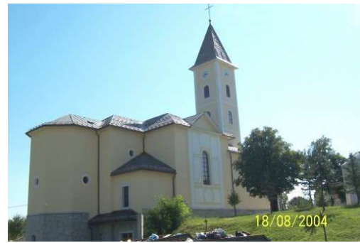
Nova crkva u Cetingradu

Crkva je sagrađena 1805., a u potpunosti obnovljena 1988. godine. Spomenik kulture. Pripadnici srpskih pobunjenika i Jugoslavenske narodne armije crkvu su prvi put pogodili granatom, 05.10.1991., 04.11.1991. zapalili, a 01.12.1991. miniranjem potpuno razorili ostatke crkve.