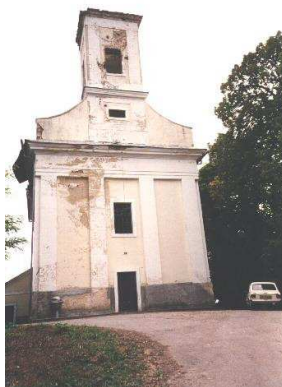
Lađevac crkva Juraj Mučenik

Crkva je sagradjena 1776. a dogradjena 1841. godine. Pripadnici pobunjenih Srba i Jugoslavenske narodne armije, krajem 1991. i u ozujku 1992., crkvu su ostetili, a unutrašnjost je spaljena.