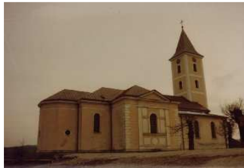
Crkva u Cetingradu prije rušenja