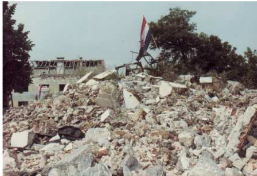
Ruševine stare crkve