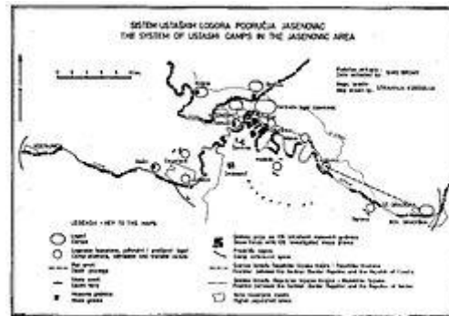
Sistem logora Jasenovac, za vrijeme 2. svjetskog rata