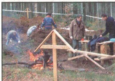
Dela naj bi trajala vse do konca tedna.