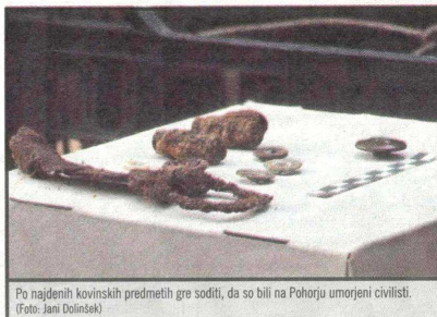
Po najdenih kovinskih predmetih gre soditi, da so bili na Pohorju umorjeni civilisti.

Na tezenskem množičnem grobišču so letos poleti pri izkopavanju posmrtnih ostankov uporabljali stroje, za kar pohorski gozdovi niso primeren. Delavka ekipe vladne komi-