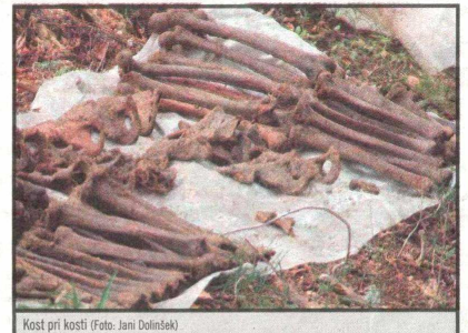
Kost pri kosti

Na presenečenje vseh preiskovalcev prikritih grobišč so v zemlji našli tudi palice plastičnega eksploziva. »Preiskovalci so pri izkopavanju našli eksplozivna telesa. Dva naša sodelavca sta na tem območju izkopala 150 palic plastičnega eksploziva. Dve palici sta imeli tudi vstavljeni vžigalnik. Po dosedanjih dognanjih je šlo za zavezniški eksploziv angleške izdelave,« nam je pojasnil Oskar Neuvirt iz regijske enote za varstvo pred neeksplozivnimi ubojnimi sredstvi.