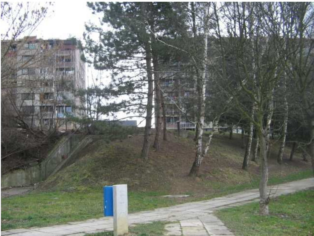
Zaklonišče na istem pancergabnu, ki pride izpod vrta... Mrakobno počutje?