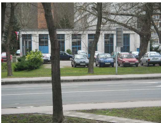
Otok Celje, kotlarna na grobišču - malo pred Plavo laguno.