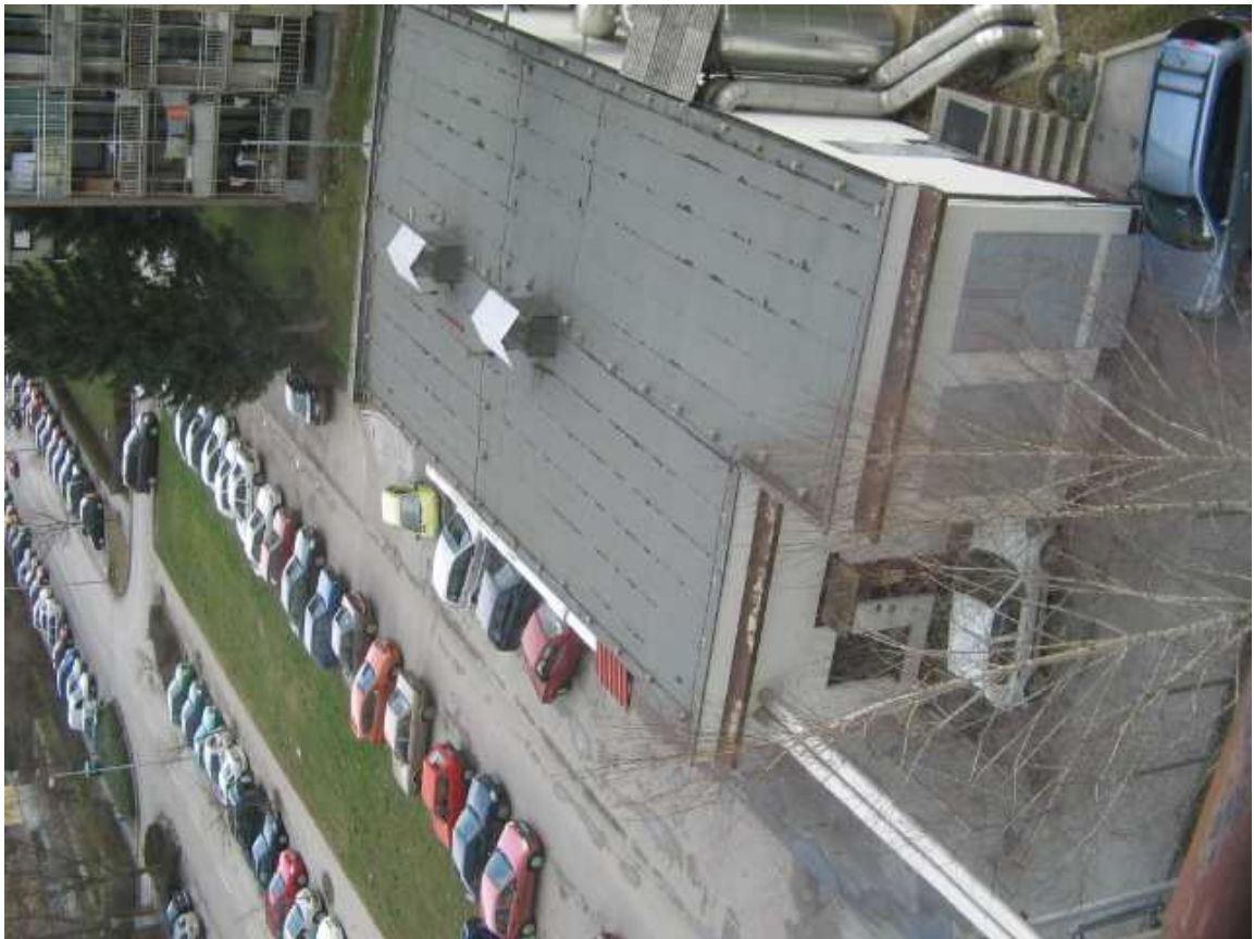
Tu spodaj (kotlarna) gre drugi graben - ki pride izpod stolpnice Pučova 5.