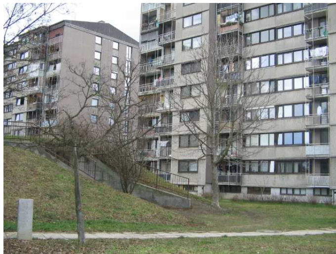
Še z druge perspektive. Zaklonišče se skoraj dotika bloka. Neverjetno!