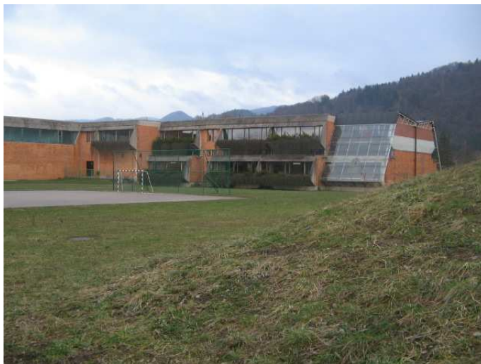
OŠ Slavko Šlander + zaklonišče.