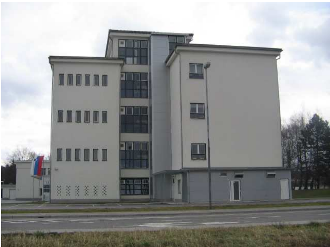
Končna postaja tega jarka - OŠ IKE. Jarek gre naprej čez Dečkovo cesto, čez parkirišče od Aero Komerciale in čez štadion Kladivar.