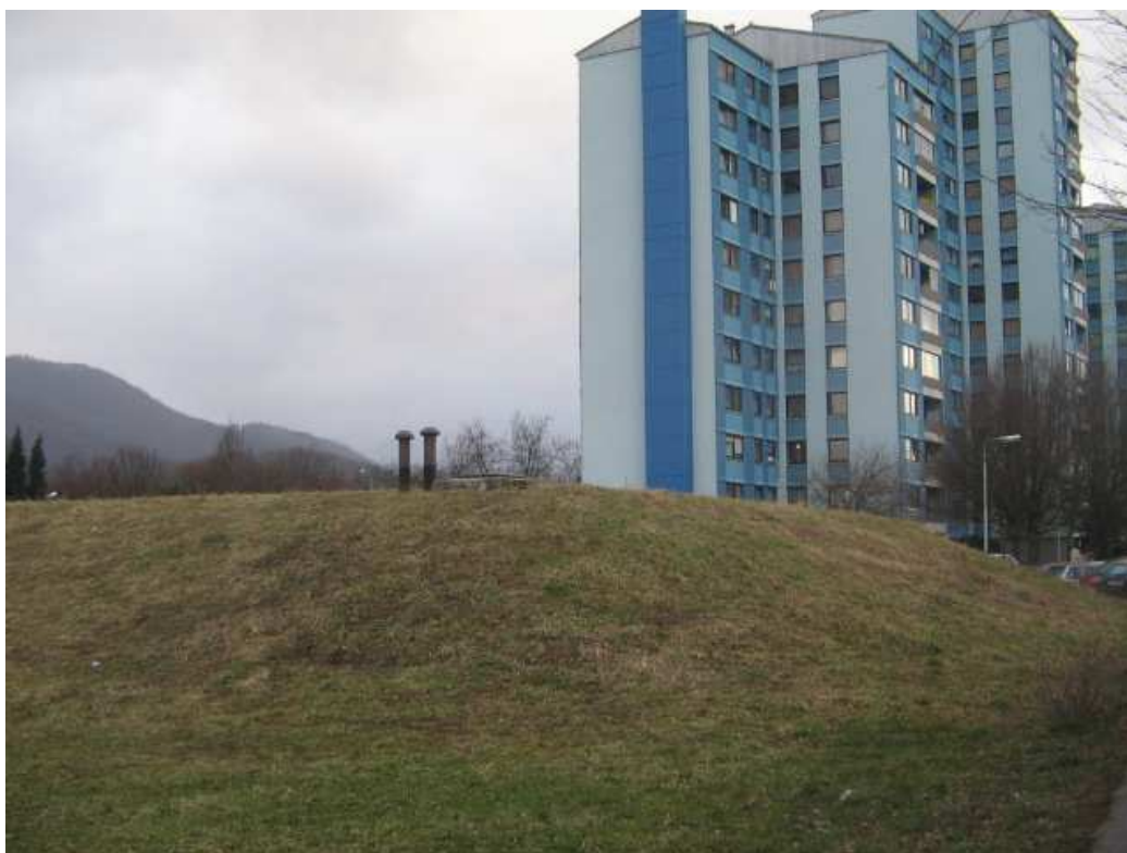
OŠ Slavko Šlander, Plava laguna - zadaj. Plava laguna, zaklonišče in bloki.