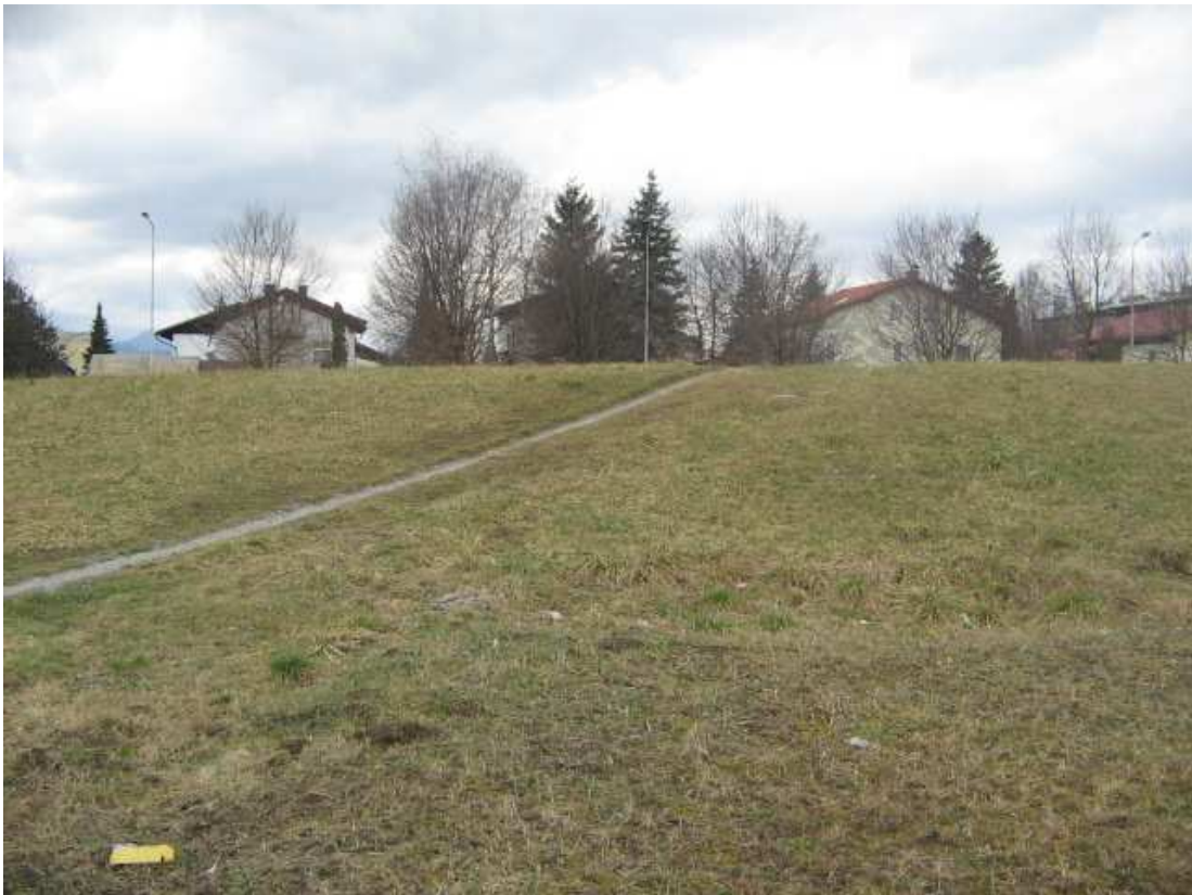
Tole je nadaljevanje - Sončni park (200 postreljenih kot strelske tarče - Nemcev).