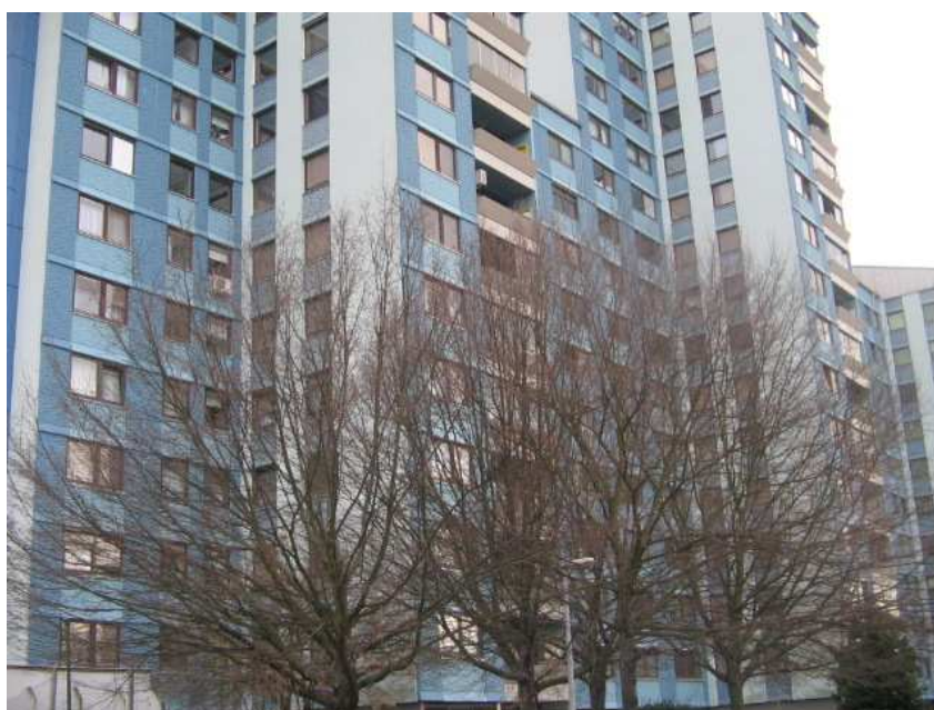
Plava laguna - bloki, zadaj.