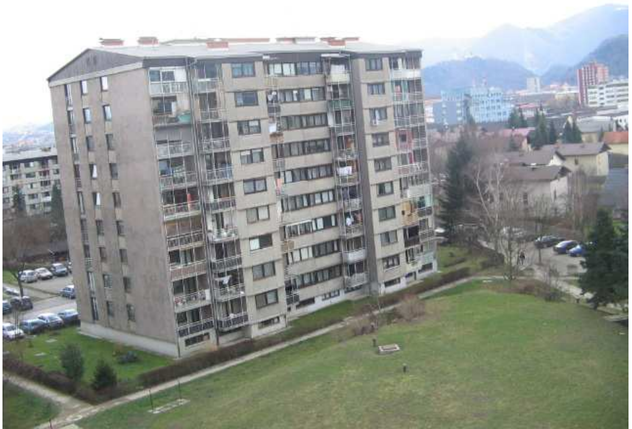
To je to : prehod pancergabna v Goriško 6-8.