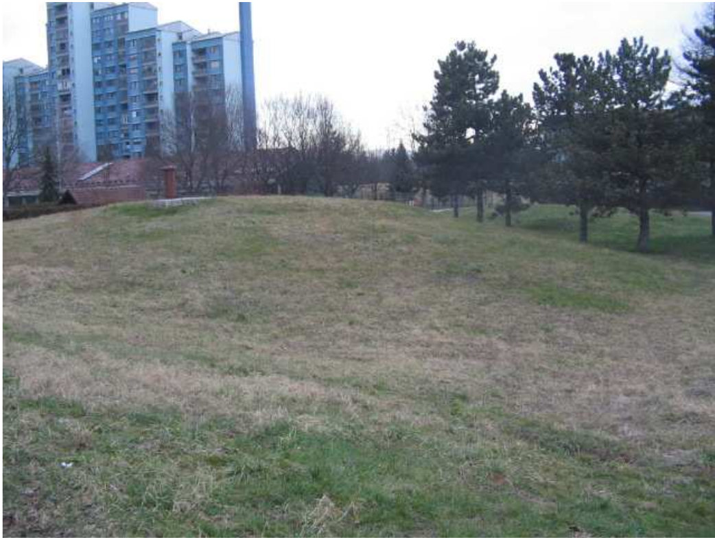
Plava laguna, spredaj.