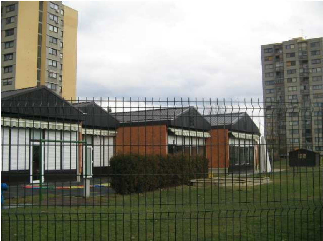
Otroštvo na mrtvaški zelenici - na polju smrti.