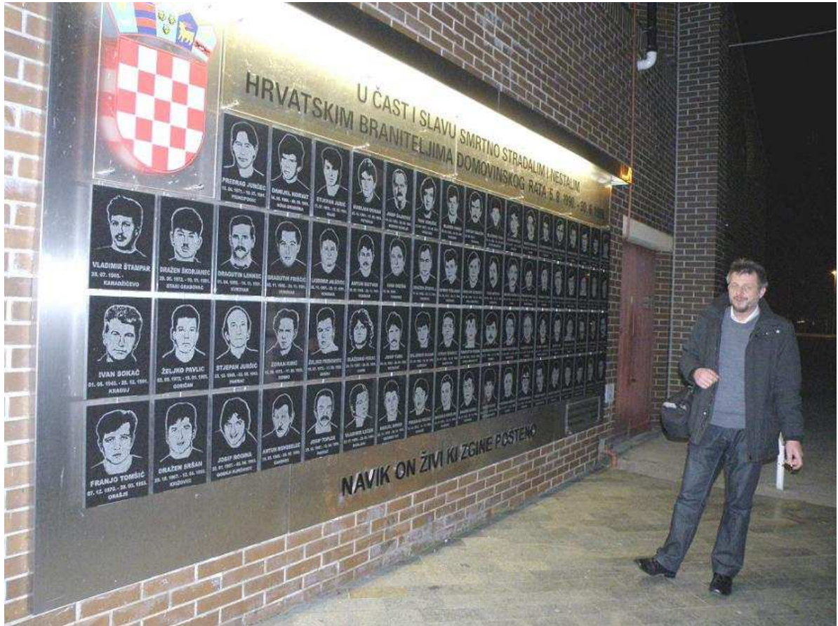
Za Pietetu tekst pripremio Franjo Talan – za objavu prilagodio Dragutin Šafarić