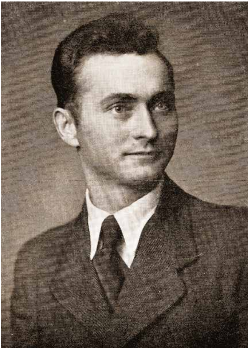
Autor u prvoj emigraciji 1939.