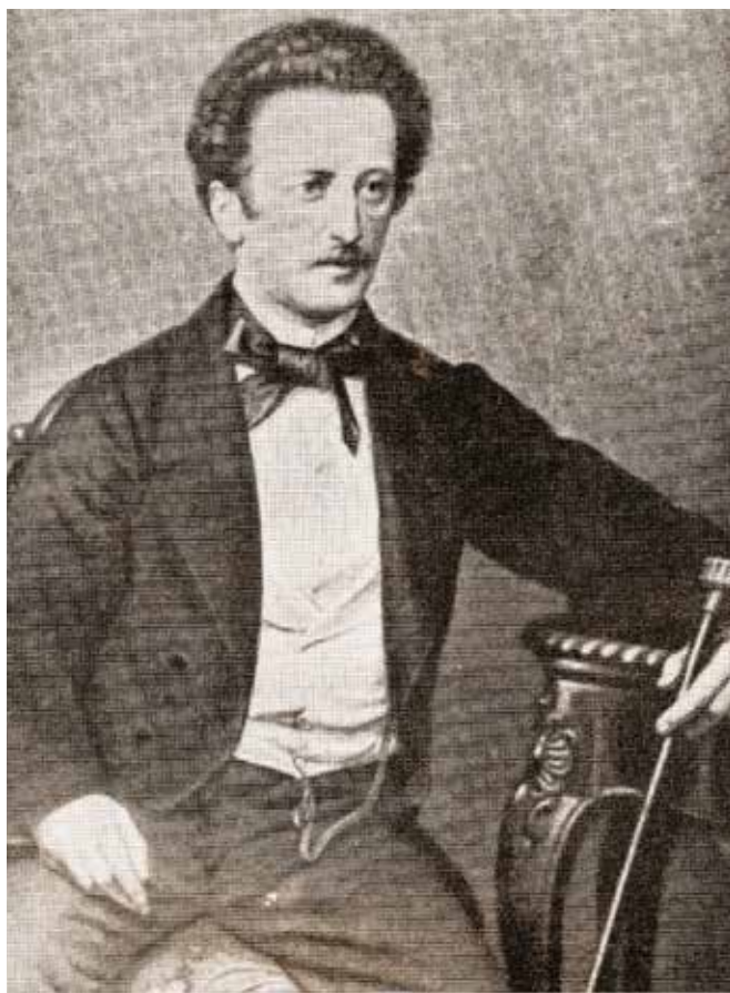
Ferdinand Lassalle, 1825.-1864.

Veliki liberalno-socijalistički odnos radnički prvoborac. Napomena pisca: Hrvat. Rad. Savez prihvaćao je ideje svih boja ako su iste bile prihvatljive i korisne za hrvatsko radništvo.