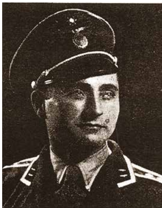
Pisac u činu zrakopl. stožernog narednika