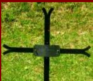
Kriz nad grobom Sulje Skendera