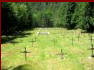
Groblje u Logu pod Mangartom