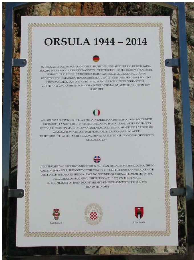
Povjesnica na stranim jezicima