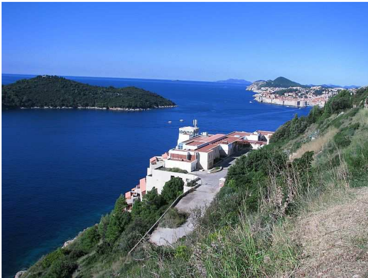
Pogled s Orsule prema Gradu Dubrovniku

Danima nakon tog strašnog zločina u listopadu 1944. mrtva su tijela plutala po moru, ispred gradske luke Dubrovnik. Komemoraciji je nazočio još uvijek dobrodržeći svjedok tih strašnih dana, 98. godišnji gospar Pavo Dalmatin. On je tada po jugu i studeni, morao isploviti na vesla s nekoliko mladića te iz mora ispred gradske luke vaditi obezglavljena i raspadajuća tijela poubijanih hrvatskih žrtava.