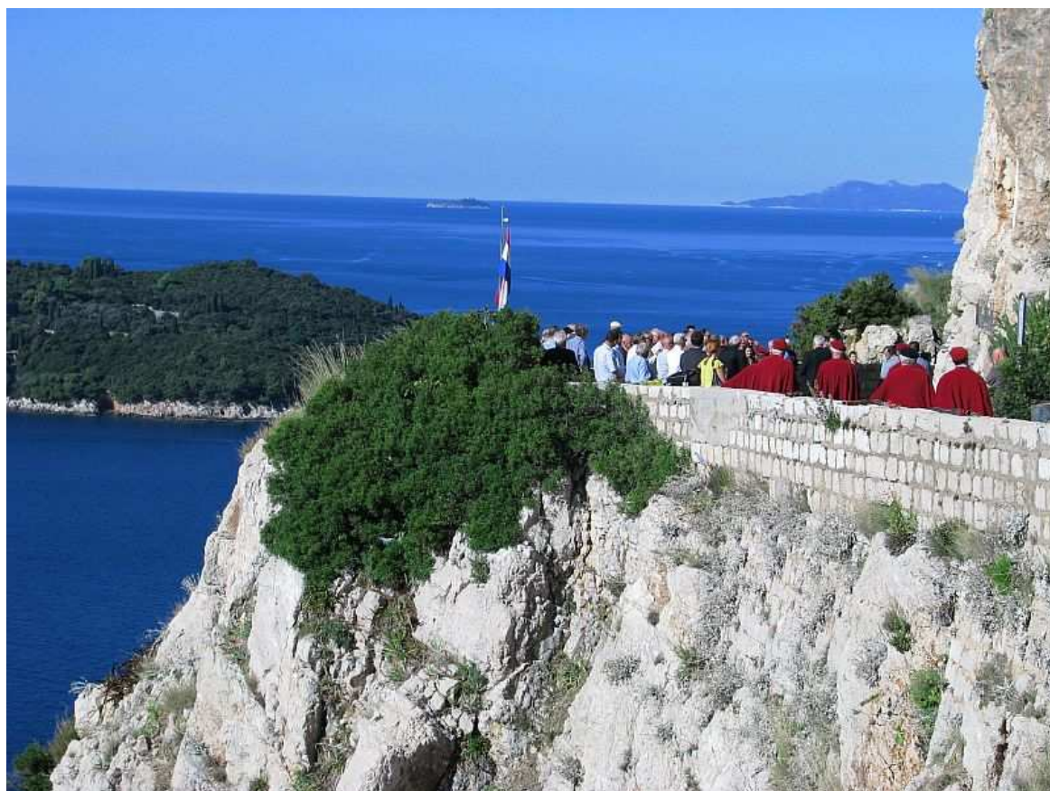
Mjesto zločina na Orsuli