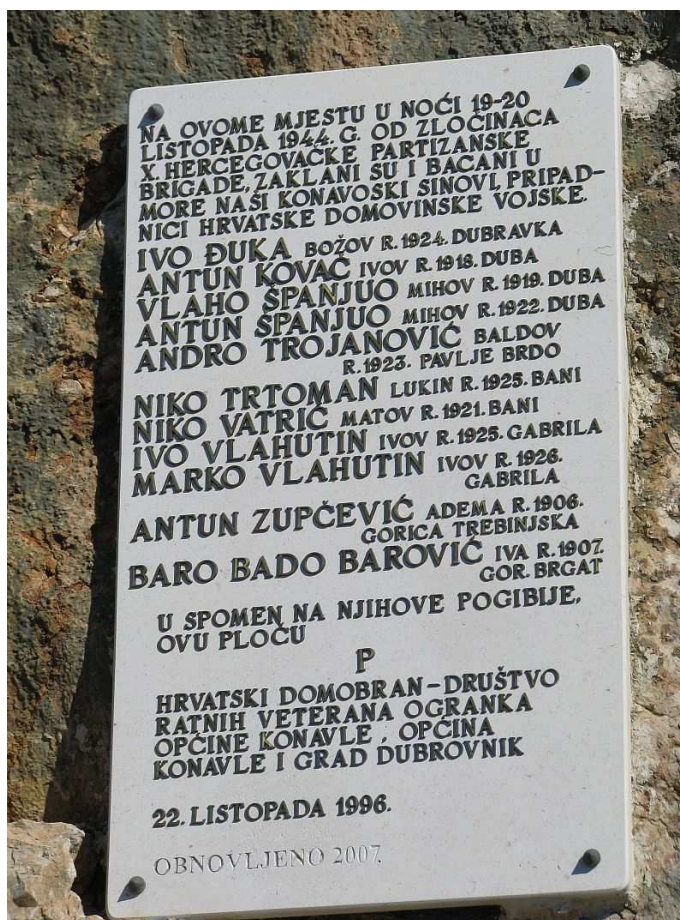
Popis stradalih žrtava