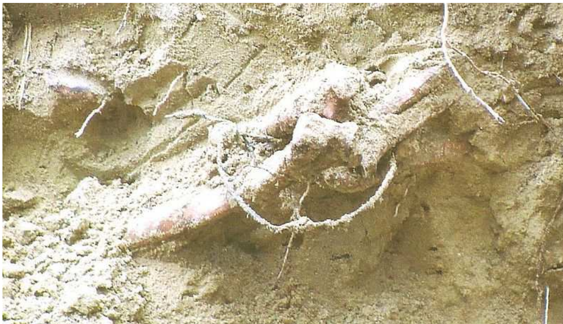
Žica na udovima iz pijeska Jakljana

Mnogi iz Hrvatske ljetuju na južnom Jadranu, no uopće ne poznaju zločine sa Orsule i Dakse. O tome se ne uči u školama, a niti su mediji skloni tim temama. Mogu li partizanski sinovi i kćeri danas na vlasti, biti bolji od svojih 'zaslužnih' komunističkih očeva? Odgovore svakodnevno dobivamo. Zadojeni komunističkim odgojem, nikada ne će biti spremni za cjelovitu istinu o Drugom svjetskom ratu u Hrvatskoj.