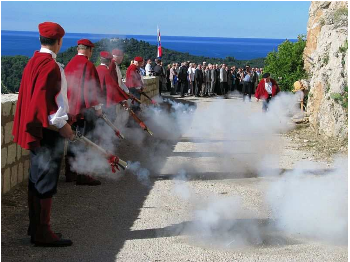
Počasna paljba Dubrovačkih trombunjera