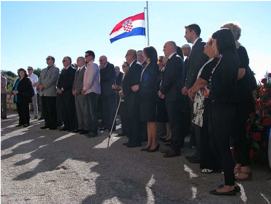
Predstavnici županije, grada Dubrovnika i općine Konavle