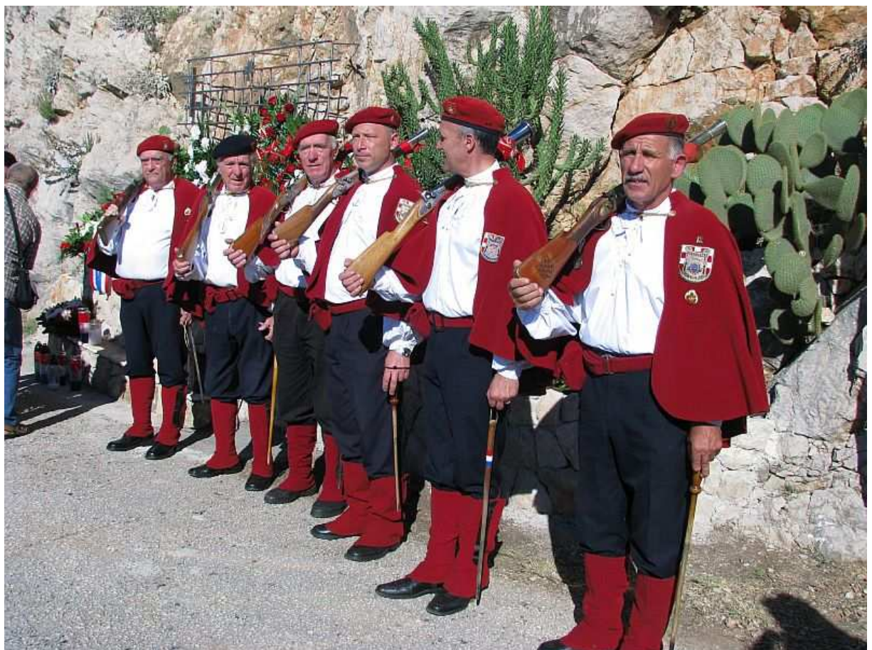
Postroj Dubrovačkih trombunjera