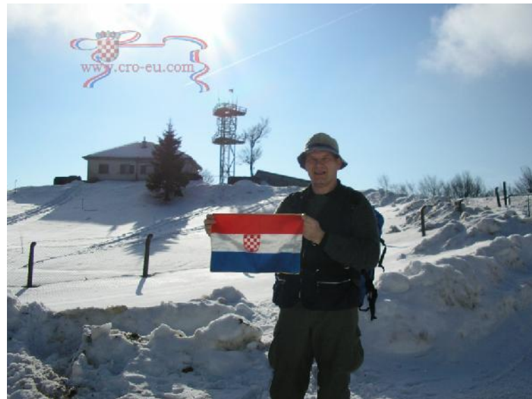
Sl. 7 Vrh SVETA GERA nekoliko km od Jazovke koji je zauzela slovenska vojska iako je vojarna na hrvatskom teritoriju.