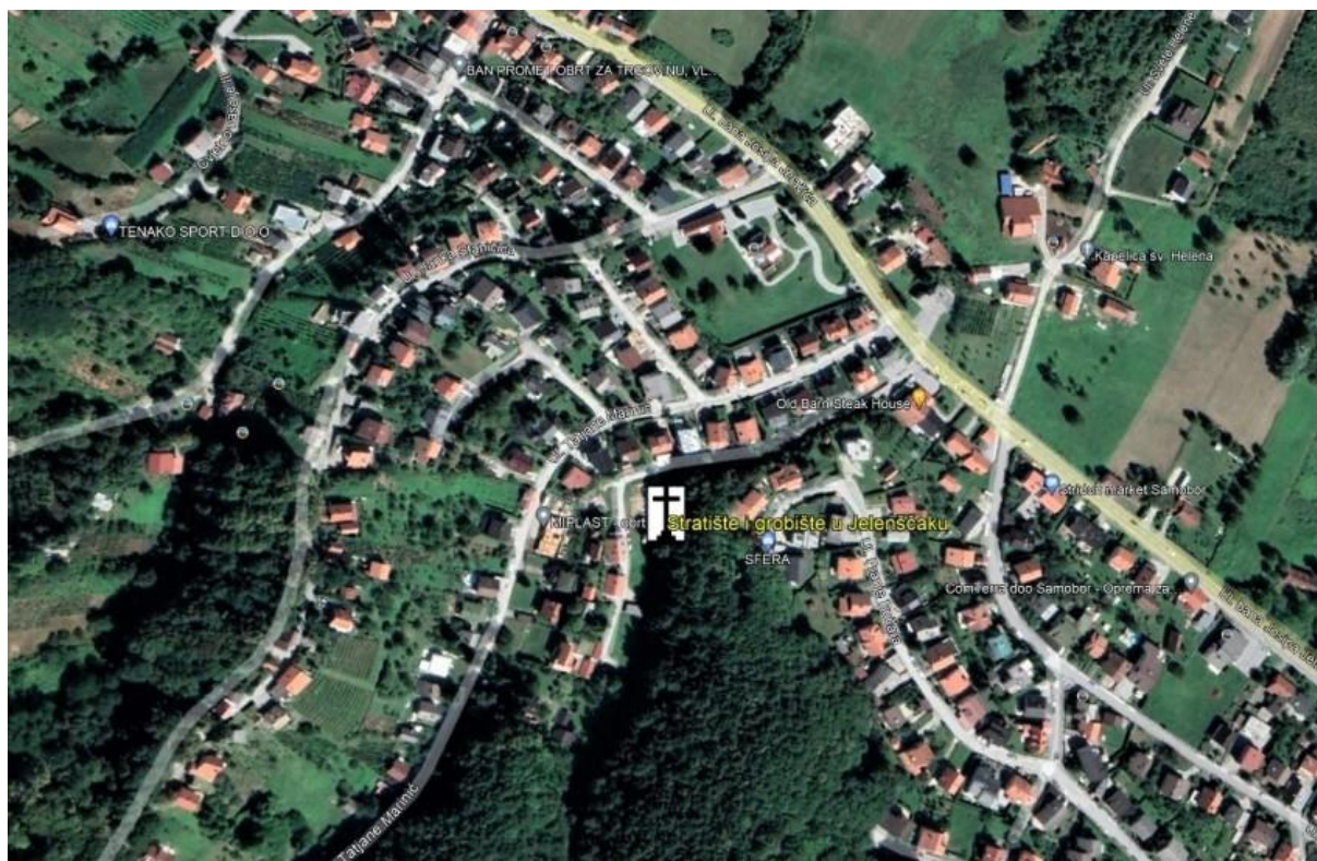
Stratište i grobište na Jelenščaku u Filipčevoj šumi

U Jelenščaku kuda prolazi električni vod visokog napona, u podnožju Filipčeve šume, zbivali su se tragični događaji za hrvatski puk. Zelena šuma na jednoj strani padine, a na drugoj prekrasni vinogradi (Pušina i Jelenščak) pružali su, a pružaju i danas, osjećaj pitomosti i ljepote ovoga dijela samoborskoga kraja. Proljeće je i kraj rata. Svi se radovahu miru i povratku kući. Umjesto mira dođe preokret. Sve se okrenulo naopako. Ljudi postadoše gori nego što bijahu u ratu.