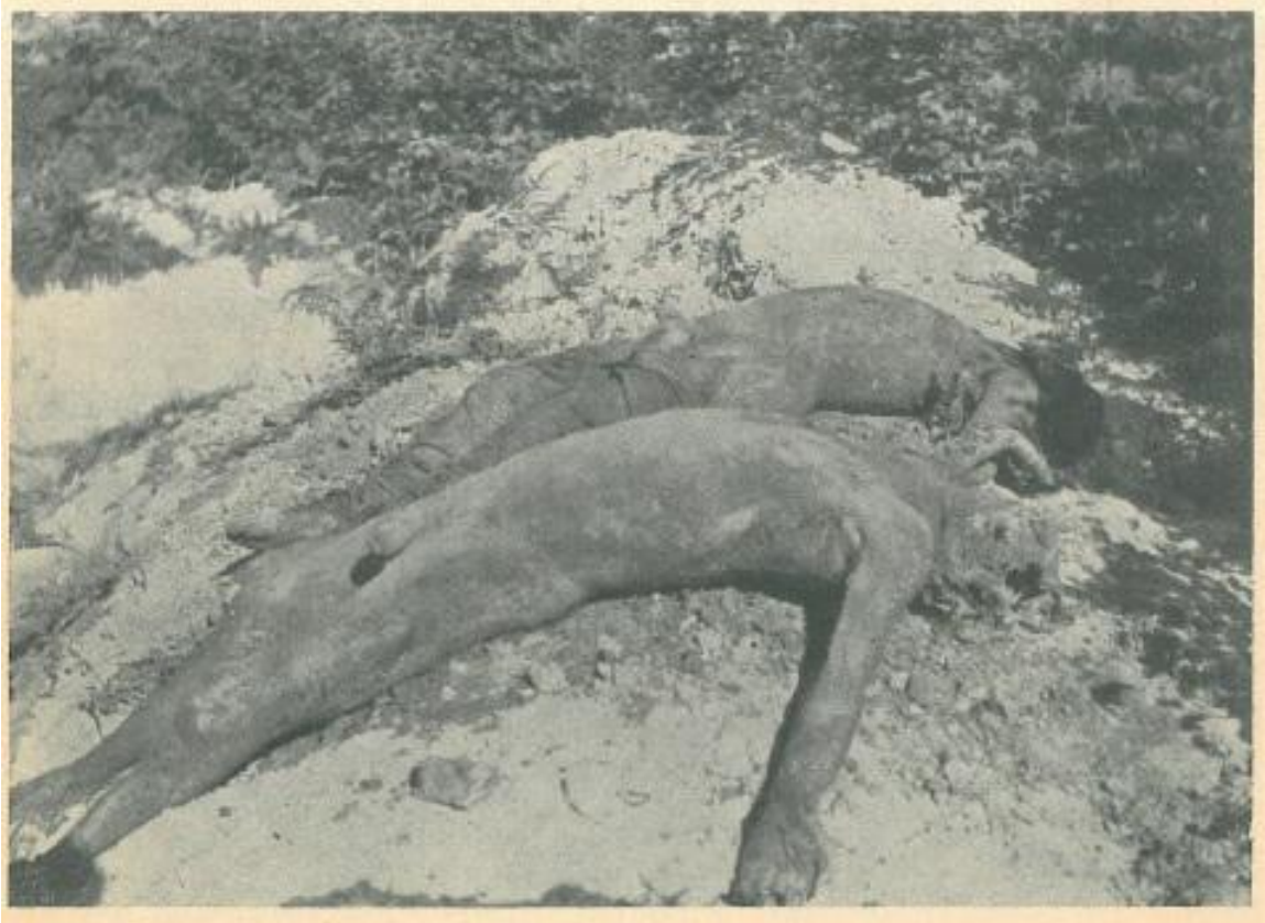
Žrtve ekshumirane u Pašincu kod Prijedora