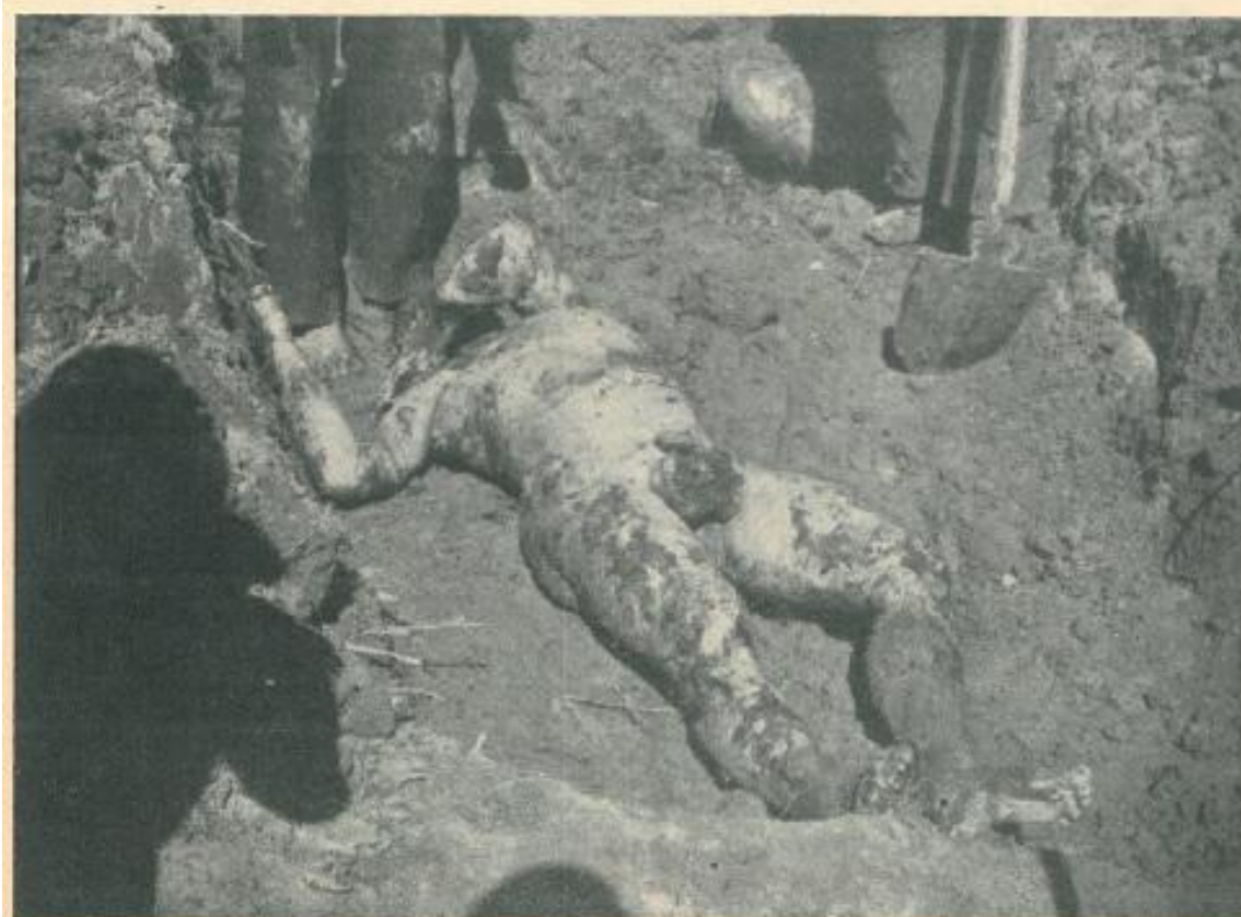
Pogled na ekshumirana mrtva tijela dvojice Hrvata na Pašincu kod Priedora