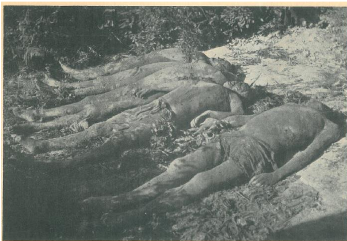
Pet tijela u Pašincu kod Prijedora sa teško unakaženim glavama