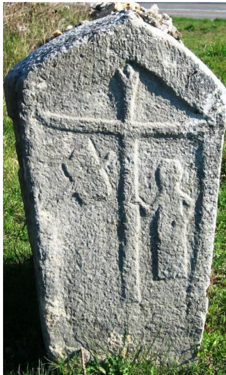
Ste ak s Crljivice

— Dakako da se zna. To su najveći i hrvatski kraljevi. Bili su gospodari zemlje od Jadranskoga mora do Dunava. Krešimir i Zvonimir ponosno su se pisali: kralj Dalmatinaca i Hrvata.