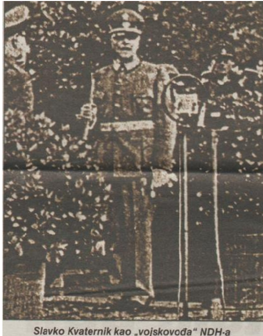
Slavko Kvaternik kao „vojskovođa“ NDH-a