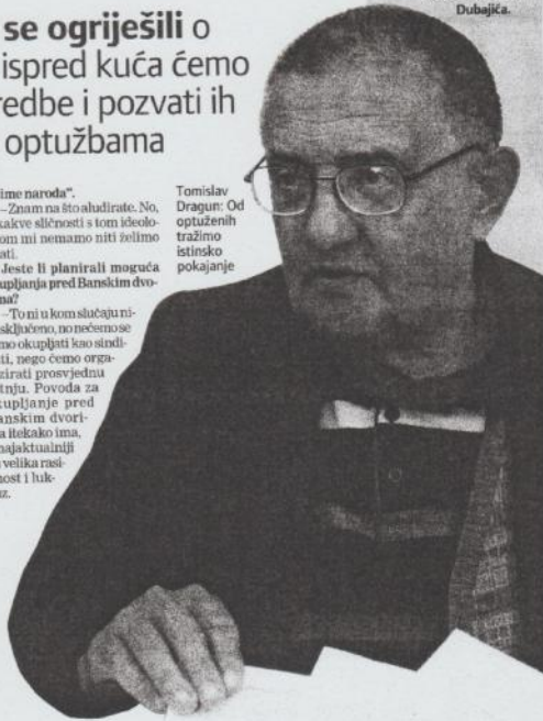
Tomislav Dragun: Od optuženih tražimo istinsko pokajanje

U kategoriji ovih potonjih, crvena diploma je nedavno dodijeljena predsjedniku Stipi Mešiću, i to zbog općeg pristupa temi partizanskih jama. Tako se našao u društvu Dubajca.