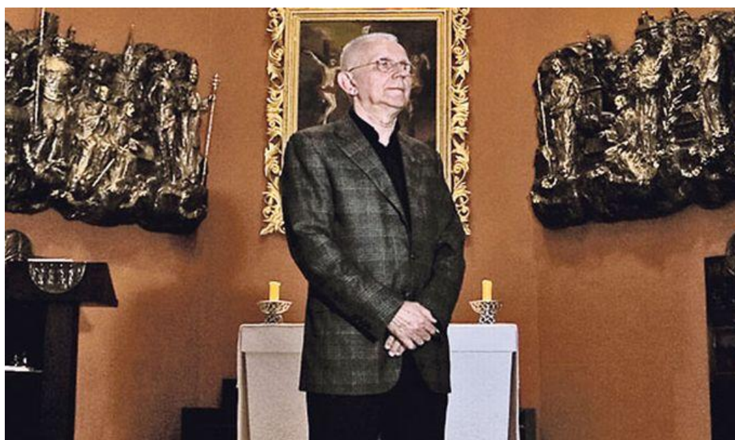
Pre asni Mijo Gabri