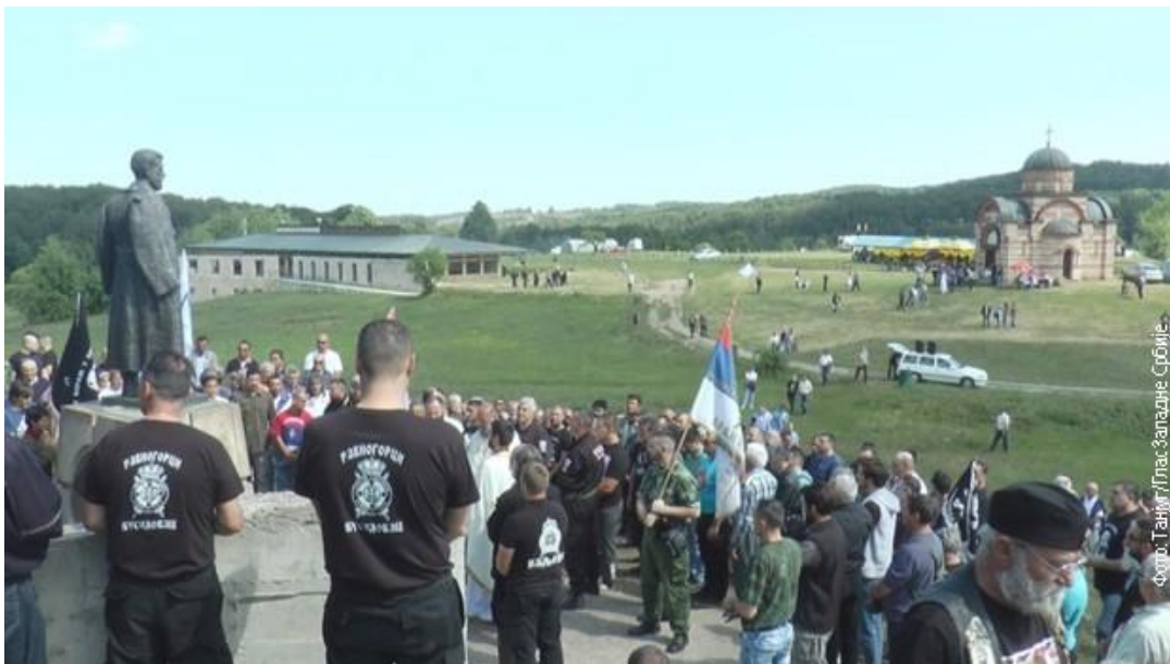
Pokret Draže Mihailovića u Ravnoj gori