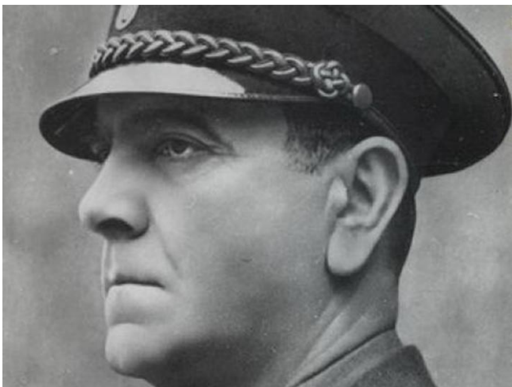
Dr. Ante Paveli

Šaka jada koja sebe naziva "Hrvatski uljudbeni pokret", a koja je najavila podizanje spomenika Anti Paveli u, kandidaturu Ante Gotovine za predsjednika kao i druženje sa etnicima po Ravnoj gori ponovo se okupila u subotu, ovoga puta ispred kuće Josipa Manolića u Nazorovoj ulici u Zagrebu.