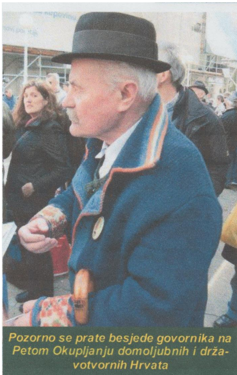
Pozorno se prate besjede govornika na Petom Okupljanju domoljubnih i drža- votvornih Hrvata