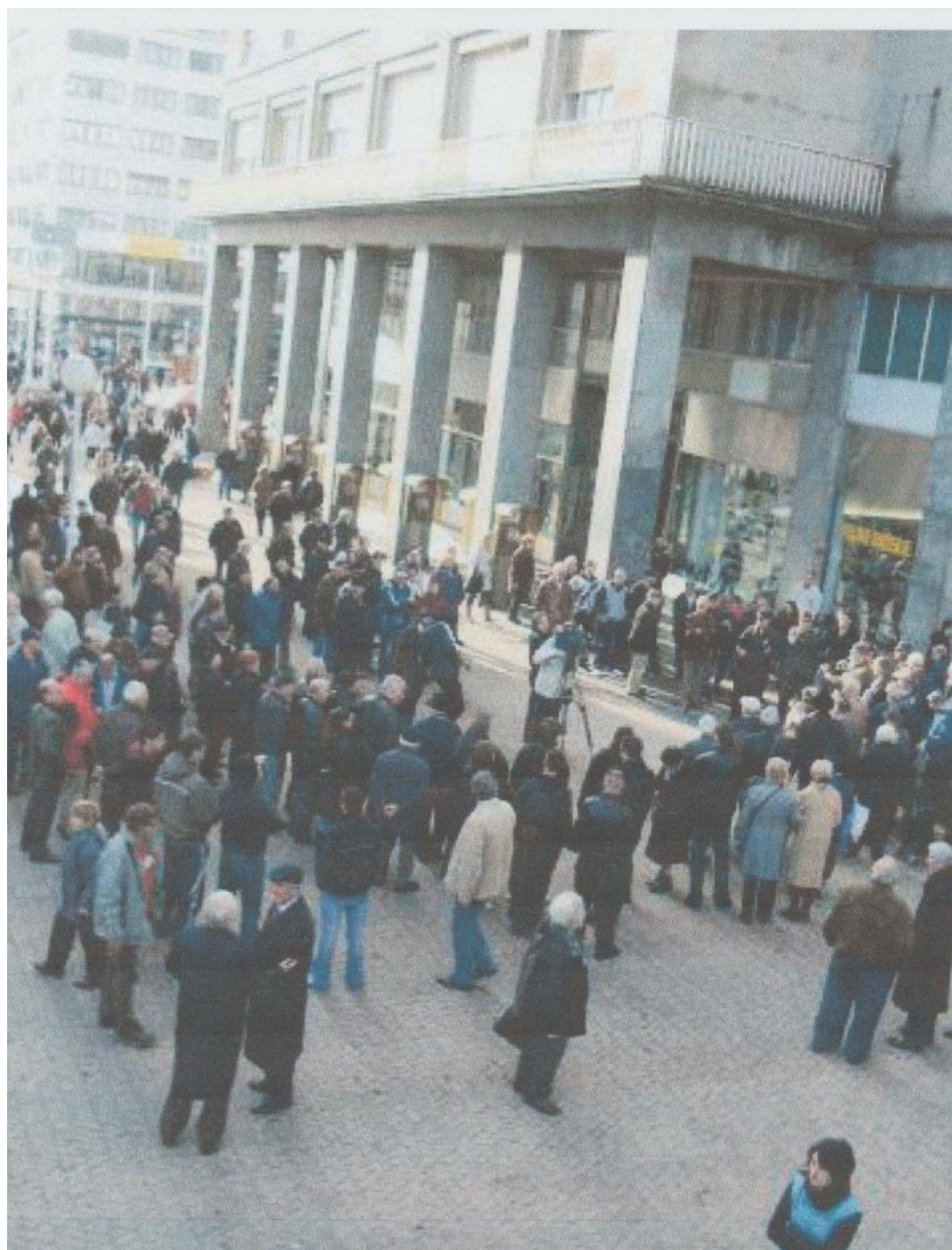
Sudionici Petog Okupljanja Domoljubnih i državotvornih Hrvata