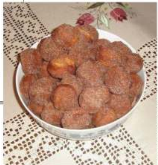
Srinica Matej Kristan Milković

2,5 dl mlijeka, 1 žumanjak, 1 žlica šećera, 45 dg brašna, 1 dg kvasca, 1 žličica soli, 5 dg masti ili 7,5 dg margarina.