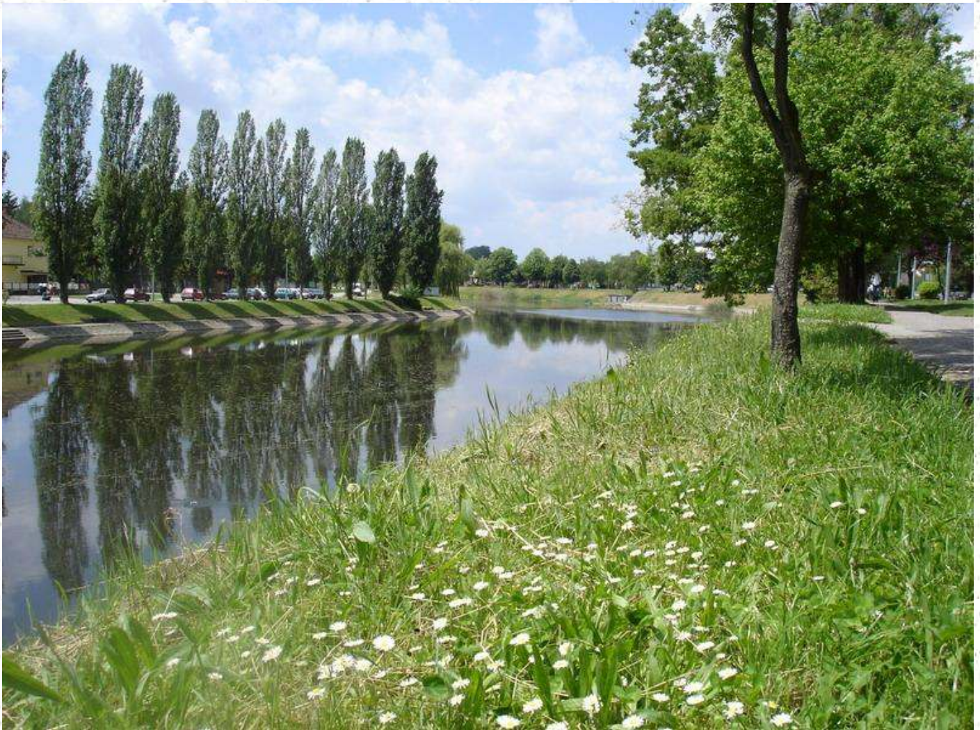
rijeka Bosut, Vinkovci