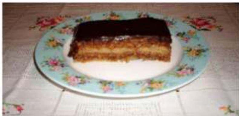
Štirnica: Matej Kristian Mirhovič

3 rebra čokolade, 3 žlice šećera, 3 žlice vode i 7 dg maslaca.