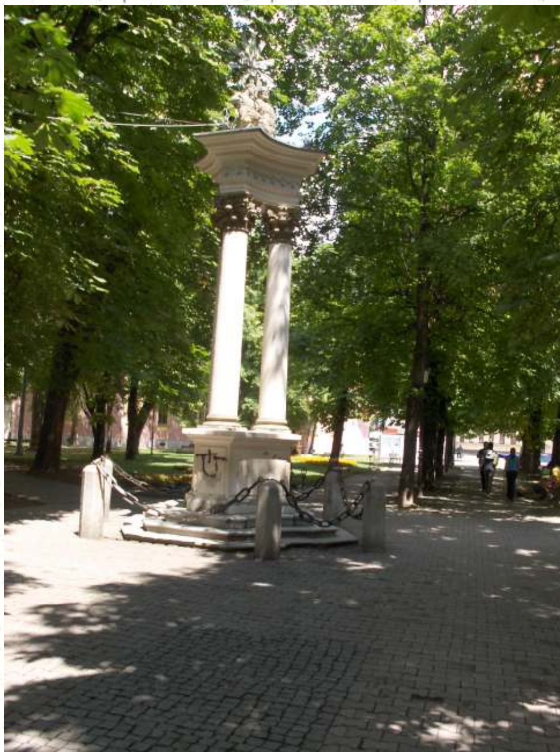
Sv. Trojstvo, Vinkovci