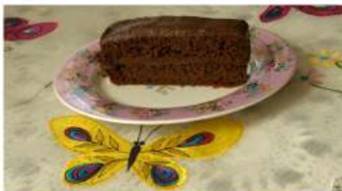
Snimio: Matej Kristan Mirković