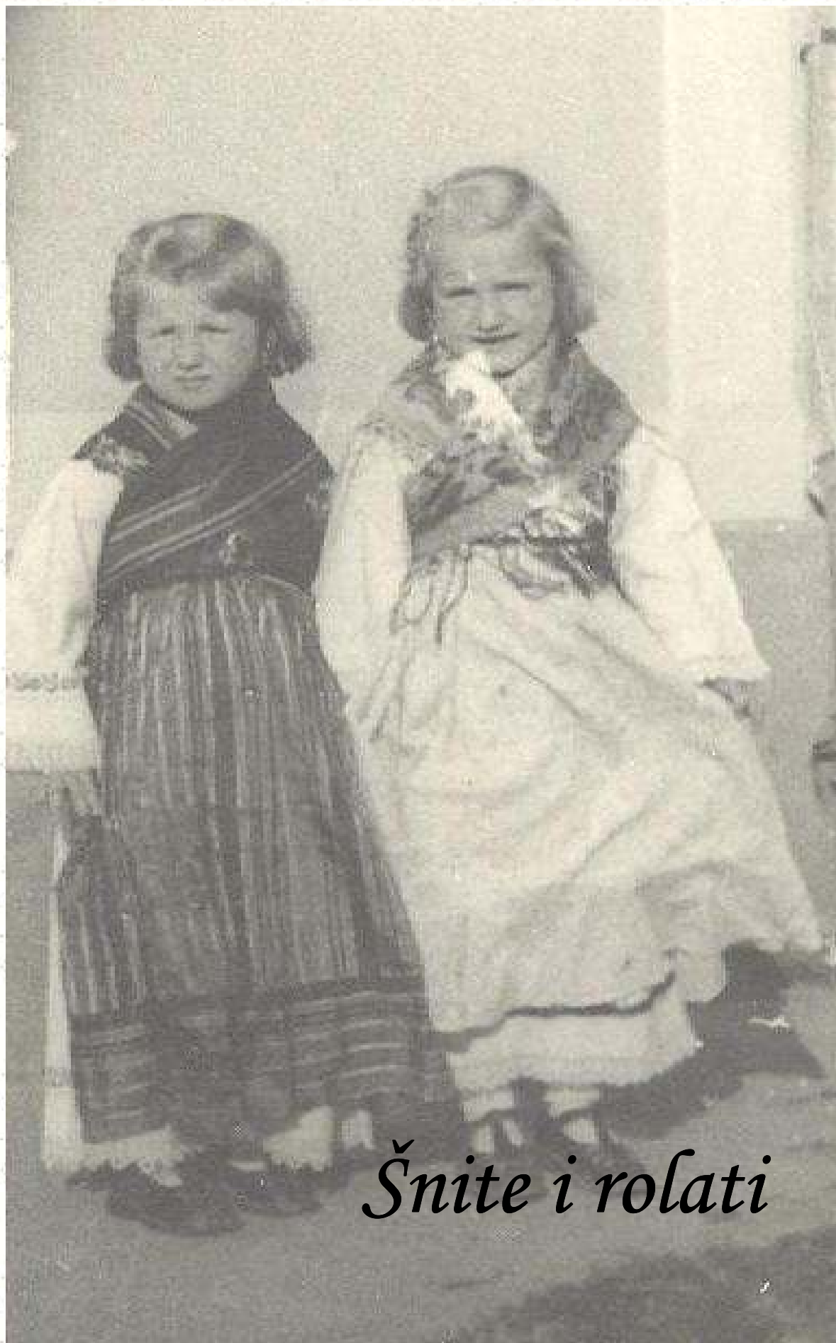
Šnite i rolati