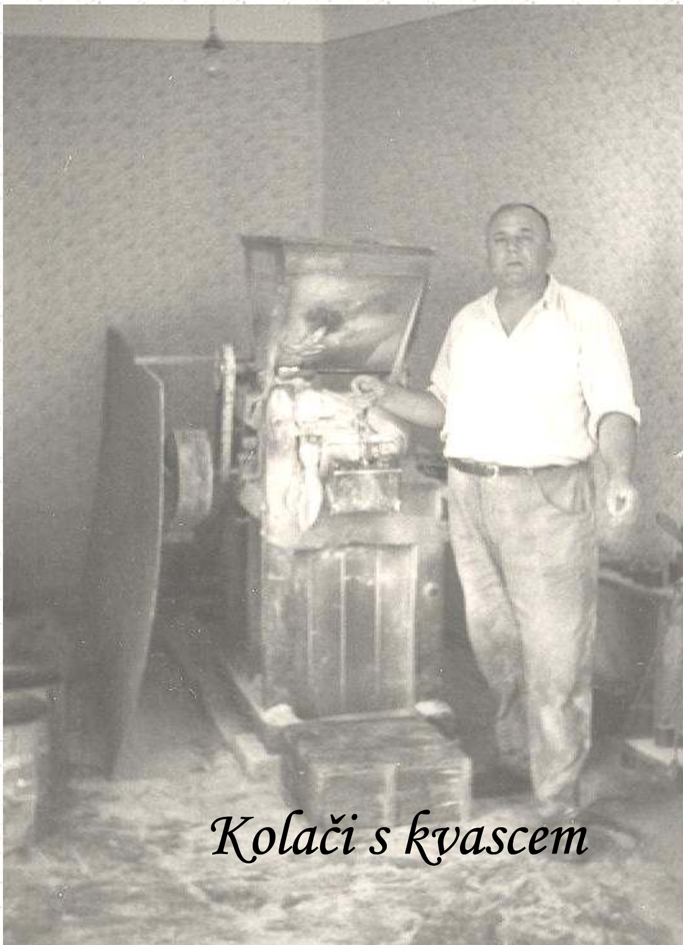
Kolači s kvascem