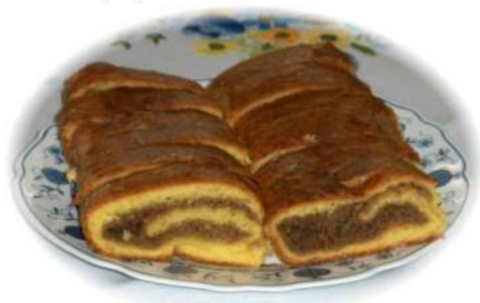
Snimio: Matej Kristan Mirković