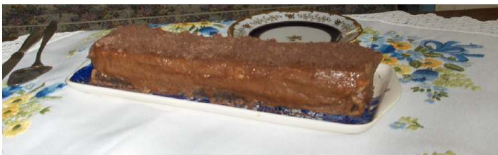
Snimio: Matej Kristan Mirković