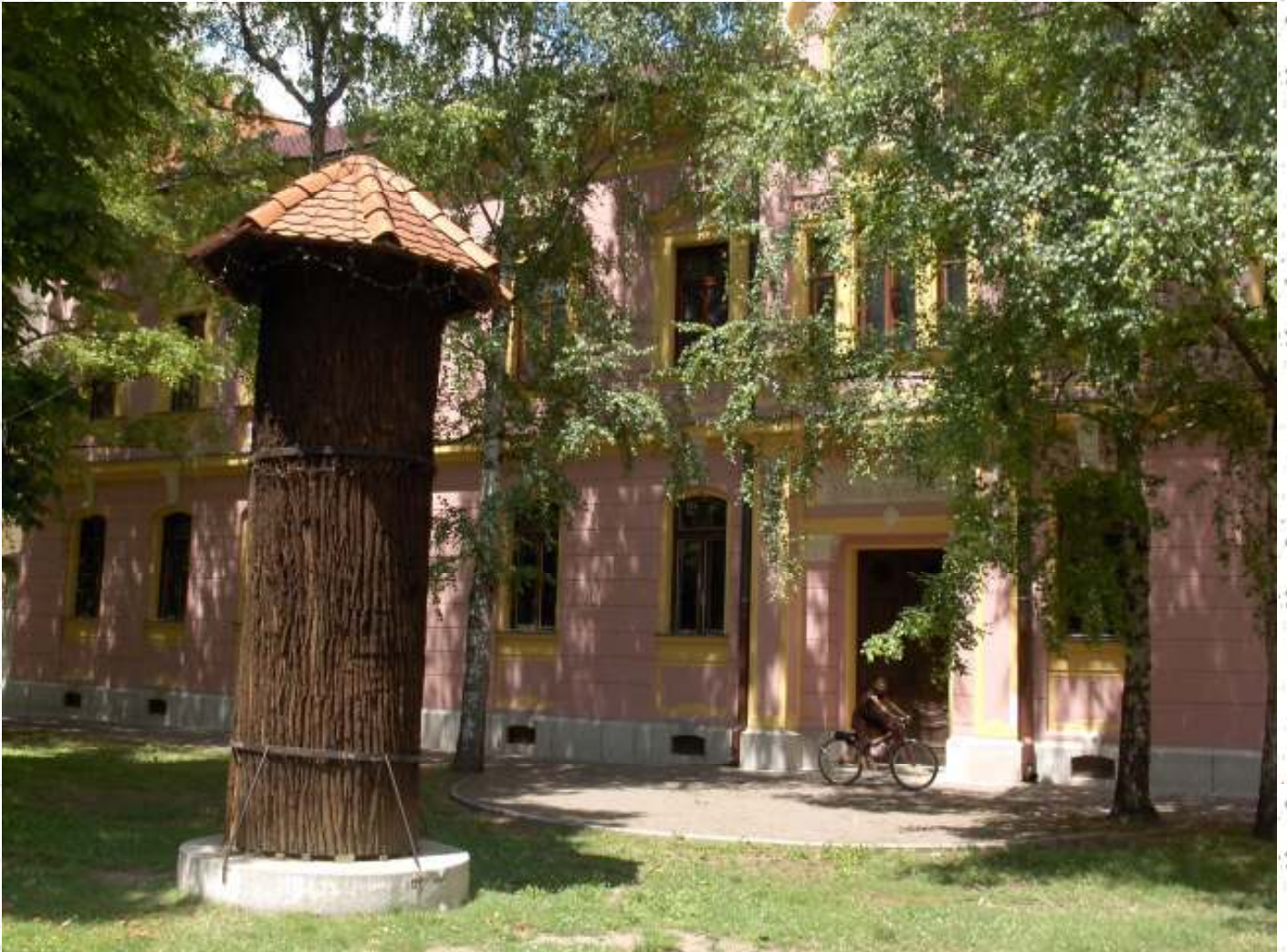
Ekonomska škola, Vinkovci