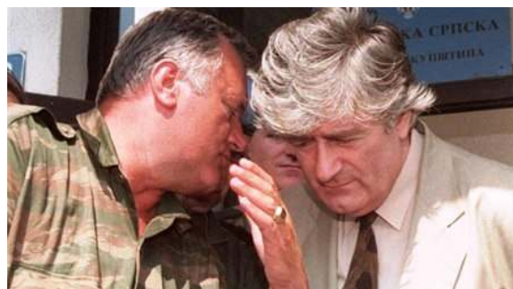
Veliki srpski rodoljubi

Međutim, kako vrijeme prolazi, počinje se oblikovati svijest naroda. (U tome veliku ulogu igra ovo što su Bošnjaci u dijaspori naučili o ponašanju političara u istinskim demokratijama svijeta i prenijeli na Bošnjake u domovi-