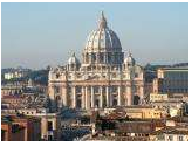
Bazilika Sv. Petra (1614), Vatikan

VRLO ODLIČNOMU MUŽU BRANIMIRU, SLAVNOMU KNEZU I NAŠEMU DRAGOMU SINU I SVIMA VJERNIM SVEĆENICIMA I ČASNIM SUCIMA I SVEMU NARODU MIR I MILOST OD GOSPODINA ISUSA KRISTA! 2