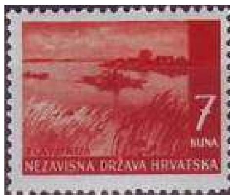
Br. 60 – Motiv iz Slavonije

3 kune, smeđekarmin (4,000.000 primjeraka)