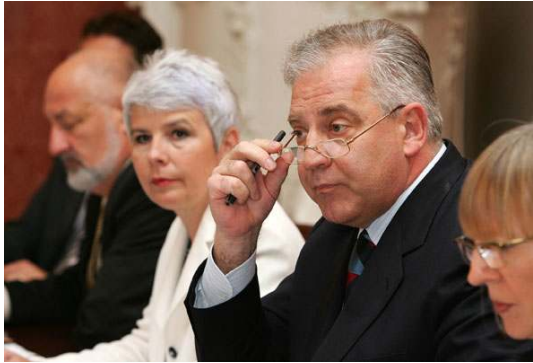
Stegnite vi remen bando lopovska!

10.000 skuplja hrabrost i izlazi na ulice, 4,000.000 sjedi doma, u zamračenim prostorijama i osluškuje, čeka da se dogodi čudo.