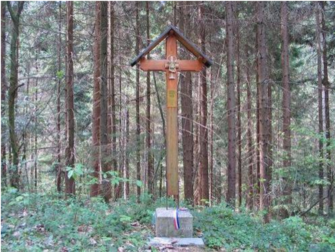
Crnogrob: Grobovi članova Vlade NDH i njihovih obitelji