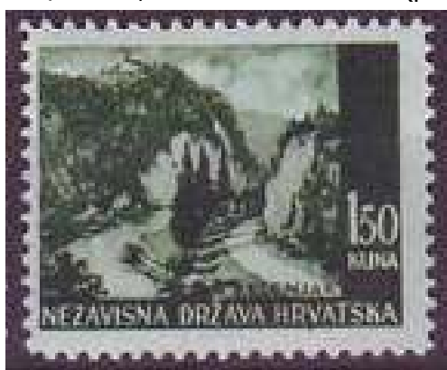
Br. 52 – Zelenjak

3,50 kune, karminsmeđa (16,000.000 primjeraka)