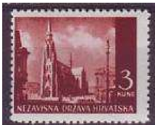
Br. 54 – Osijek

6 kuna, smeđemaslinasta (3,600.000 primjeraka)