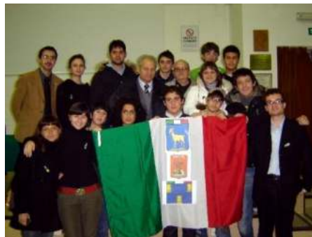
Foibe e degli esuli istriani

Kršćanska sadašnjost je dopremila iz Domovine desetak golemih fotografija naših sakralnih zdanja iz vremena Trpimirovića i izložila ih u velikim dvoranama tog velesajma u Riminiju, u kojem živi nemali broj „ezula“. Ta hrvatska predromanika od Istre do Boke bila je veliki kulturni i politički događaj, jer su Talijani dopuštajući tu izložbu, priznali da je sva istočna Jadranska obala - hrvatska obala bila i ostala oduvijek. U predviđenom slijedu predavanja, u jednoj od dvorana u blizini hrvatske izložbe, pročitao sam na talijanski jezik preveden moj podnesak pod naslovom „Katolička vjera u kulturi i povijesti hrvatskoga naroda“. N.B. Na taj masovni slet u Riminiju došao je talijanski ondašnji ministar vanjskih poslova Andreotti, a i papa Ivan Pavao II. Toliku težinu je imalo predstavljanje „one druge Hrvatske“ Talijanima, našim prekomorskim susjedima s kojim smo, po velikom broju kod nas ostalih, a u Italiju doseljenih Ilirami zapravo i - krvni srodnici.