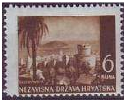
Br. 59 – Dubrovnik

1,30 kuna, zelena (18,000.000 primjeraka)