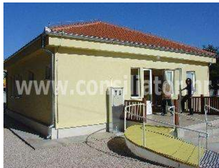
Eko kuća u Šibeniku

u Berlin i Hamburg. Vanjski sloj zgrade je pokretni zaklon (španjolski zid) s lamelama u kojima su ugrađeni fotonaponski elementi. Krov je također pokriven s fotonaponskim panelima. Toplu vodu za kućanstvo i grijanje proizvode dodatni solarni termički kolektori. Unutarnji sloj je izoliran s pločama u vakuumu. Sama jezgra zgrade je okružena s kutijama iz gipsa ispunjenim s tzv. kemijskim izolatorom PCM (Phase Change Material). Ako je zgrada pretopla PCM apsorbira toplinu i time hladi njenu unutrašnjost, ako je u zgradi hladno PCM emitira skupljenu toplinu i time grije unutrašnjost.