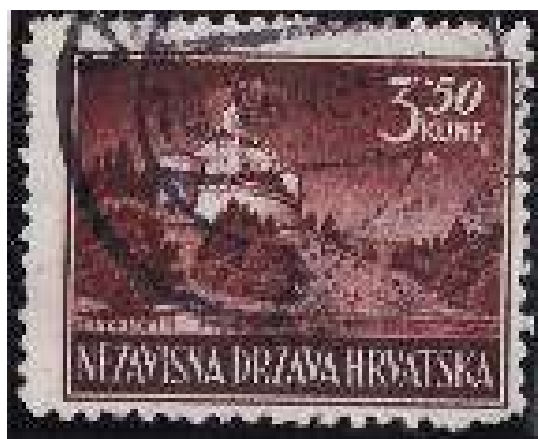
Br. 55 – Trakošćan

25 banica/2 kune, karmin ta mocrvena (pretisak)