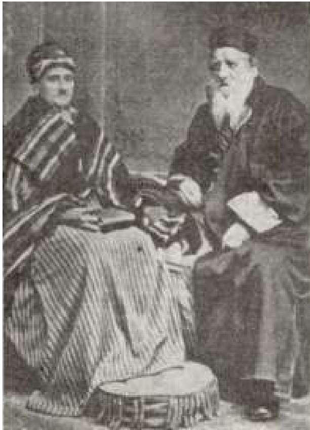
Rabin Jehuda ben Šaloma Haj Alkalaj