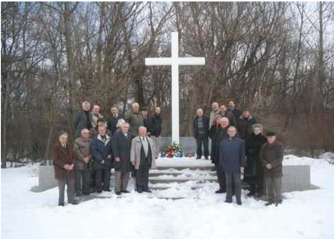
Spomen križ „Dravska šuma“ (snimka iz 2005.)