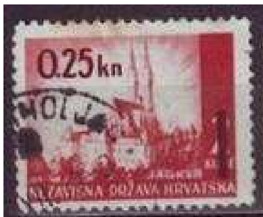
Br. 48 – Zagreb

25 banica/2 kune, karmin ta mocrvena (pretisak)