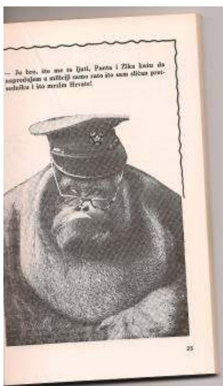
Lice poznato skoro svim Titovim robijašima

Riječ je o jednom od najznačajnijih imena u povijesti Crkve - o Benediktu (Dobroslovu). Sveti Benedikt smatra se, i kod katolika i kod pravoslavnih kao - utemeljitelj redovničkog života u povijesti Crkve Kristove. Od Svetog Benedikta, koji je živio u petom i šestom stoljeću (*480 - +547), izredalo se je u nizu papa u Rimu evo - šesnaest pontifexa maximusa koji su uzeli naziv Benedikt, svakako želeći svojim pontifikatom