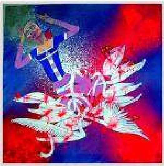
Iris & Slobodan: Smrt majke Jugovića

Dvije rezolucije Europskog sabora i jedna deklaracija Hrvatskog sabora zahtijevaju lustraciju iz javnog života i vođenja državnih poslova svih komunističkih dužnosnika, svih njihovih doušnika i pomagača. Rečeno, napisano i ne-činjeno – u Hrvatskoj.