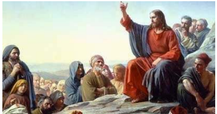
Govor na Gori

njinim riječima već u svem njegovom življenju (osobito kako vidimo u njegovim spisima i životopisima) to veoma jasno. Franjo kao i Isus ne hvali bijedu, siromaštvo, zlo, nepravdu ... Već on hvali darežljivost, strpljivost, ljubav, dobrohotnost, blagost, odvažnost, vjernost, mirotvornost, uzdržljivost, čistoću ... A ako se sjećamo to su plodovi Duha o kojima sv. Pavao govori u Poslanici Galačanima (Gal 5, 22-23).