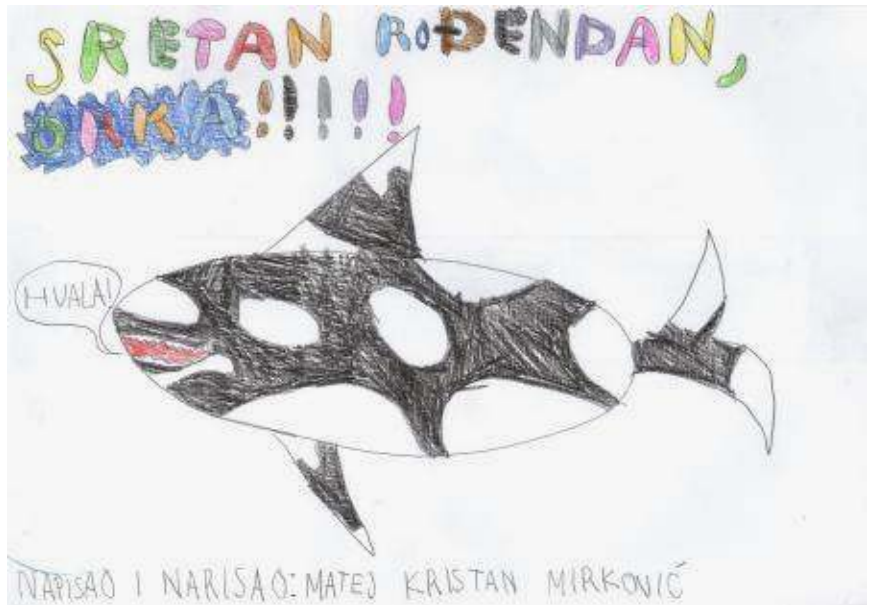
Autor: Matej Kristan Mirković (10 godina)

Ženke su spolno zrele s oko 15 godina. Trudnoća traje od 15 do 18 meseci. Rađaju otprilike na svakih pet godina, u bilo koje doba godine. Majke mlade doje sve dok ne napune dvije godine, ali s godinu dana mladi se počinju hraniti čvrstom hranom. Ženke se pare sve dok ne napune oko 40 godina. Obično ženke dožive 50 godina, dok u nekim slučajevima mogu doživjeti starost od 80 pa čak i do 90 godina. Mužjaci žive kraće, oko 45 godina.