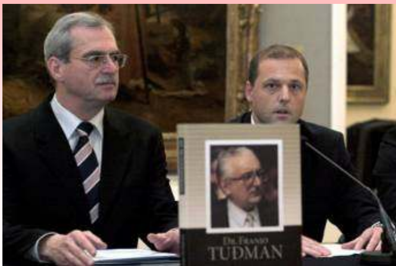
Prof. dr. sc. Andrija Hebrang: „Kad Vam ja kažem ...“

OSNOVAN FOND ZA DOSTOJANSTVENI SPROVOD STJEPANA MESIĆA POLITIČKI DIVOVI