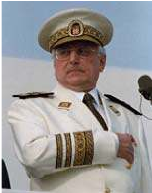
Dr. Franjo Tuđman