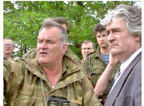
Ratko Mladić i Radovan Karadžić

I tako, "dok su jedni gladovali i kopali tranšeje drugi se nisu presvajali ženiti. Tako je jednog dana prostrujala vest da se Naser oženio. Kako je bio gospodar smrti i života, mislio je da u Srebrenici može prevrnuti svaku. Na kraju mu je za oko zapala neka Zlata iz Kamenice, kod Zvornika. Cura nije htela da se švaleriše, ali je htela da se uda. Kako drugog izbora nije imao, Gazda se oženio i doveo je kući. Nakon prospavane noći, oterao je Zlatu..."