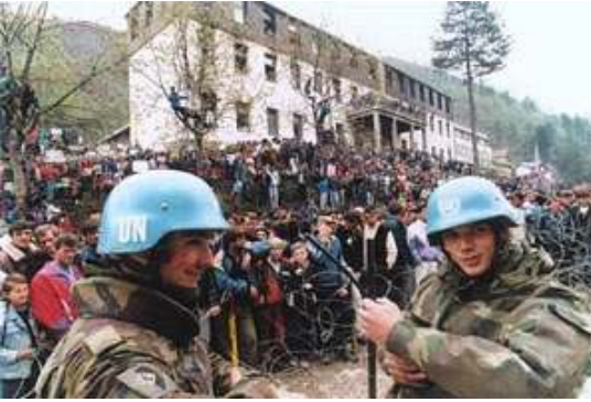
Nizozemci u Srebrenici