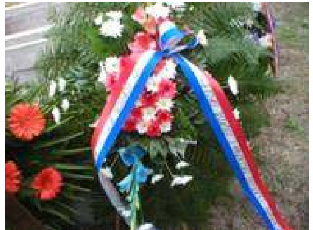
Za Dom spremni!

Tebi dragi naš suborče Ilija želimo laku hrvatsku zemlju i blažen život na onom svijetu.