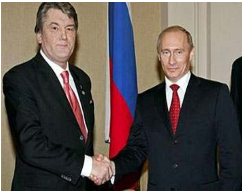
Vladimir Putin i Viktor Juščenko

Povjesničari s obje strane slažu se da je glad bila izazvana nakanom sovjetskog diktatora Josifa Visarionoviča Staljina da što više žitarica izveze, kako bi skupio novac za izgradnju novih tvornica i kupovinu oružja.