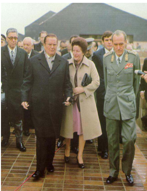
Pravo društvo – Ha, ha, ha

Predsjednik Mesić kao glasnogovornik jugo-komunističkih partizana zahtijeva reviziju povijesnih školskih udžbenika, povratak naziva ulica iz socijalističkog totalitarnog doba i partizanskih spomenika, što je također neprihvatljivo, jer bi to značilo mijenjanje društvenog poretka i protuustavni akt, a s obzirom da se hrvatski Ustav temelji na demokraciji, ne i na socijalizmu, kao i na antifašističkim vrijednostima, a ne na boljševizmu kakav je postojao u Titovoj SFRJ. Partizanski spomenici koji su srušeni od 1990. do danas mogu se postaviti u Memorijalni muzej zločina i žrtava komunizma u Zagrebu, za koji je potpredsjednica vlade RH, g-đa Jadranka Kosor, obećala u dopisu našem Centru, da će vlada na svojoj sjednici ozbiljno razmotriti utemeljenje takve jedne vrijedne institucije za obrazovanje i prosvjećivanje novih generacija o