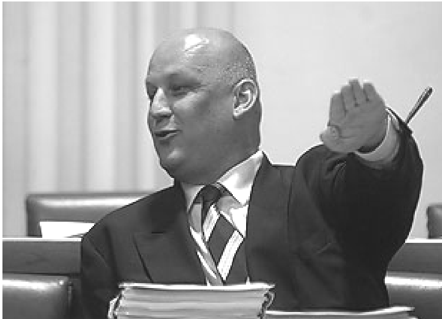
Znade li on tko je sve jamio?

Razlog izdavanja ove knjige, traženje je početka skretanja Hrvatske u bespuće uz diferencijaciju zasluga i devijantnog puta onih ljudi koji su stvarali Hrvatsku. Zasluge onih koji to zaslužuju treba podići na pijedestal, ali i valorizirati sve ono loše što se dogodilo u tom stvaranju. Zasluge i devijacije upisane su u povijest upravo tekstovima koji su