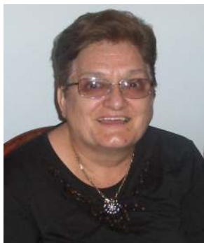
Pripremila: Marija Dragun rođ. Takšić