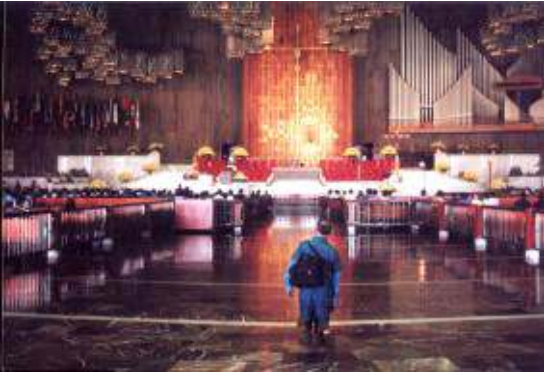
Naša Gospa od Guadalupe

Očito mi je bilo, da on pretpostavlja da je hram što ga vi tražite moja izmišljotina i hir moje mašte, a ne izražaj vaše volje.