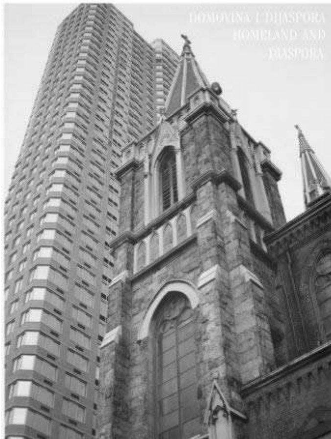
Crkva Sv. Jeronima - Chicago

priloga i TV intervjuja na hrvatskom i engleskom jeziku u hrvatskim zajednicama diljem Amerike i Kanade! I oni ostaju za povijest! Ostaju video zapisani. Vrijedno ih je spomenuti i sjećati se tih događaja i to su jedini događaji koji su profesionalno i veoma kvalitetno zabilježeni filmskom i TV kamerom u riječi i slici u iseljenoj Hrvatskoj o iseljenoj Hrvatskoj! Iskreno se molim i nadam od svega srca da domovinski i iseljeni Hrvati pokažu više zanimanja, pozornosti i spoznaja o ovim dokumentarnopovijesnim filmovima i TV emisijama, priložima i TV intervjuima, jer oni govore o nama iseljenim Hrvatima. Kako smo živjeli? Zaš-