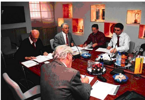
Iz rada Hrvatskog svjetskog sabora

Postoje dokazi o nebrojenim zlim namjerama birokracije prema iseljenicima, koji su htjeli osigurati povratak u domovinu ili ući u poslovni odnos sa svojim znanjem i kapitalom, ali su poslije „pravni“ vrtuljaka i poznatih