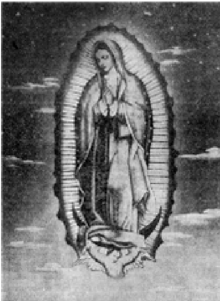
Naša draga Gospa od Guadalupe

Presveta Djevica se otvoreno i vrlo jasno predstavila Juanu Diegu. Kazala mu je zašto je došla, što želi i što hoće. Zamolila je Indijanca da uloži svu svoju brižljivost u povjerenju mu zadaću i obećala mu je nagradu za njegovu uslugu. Juan Diego se odmah odlučno prihvati svoje zadaće.