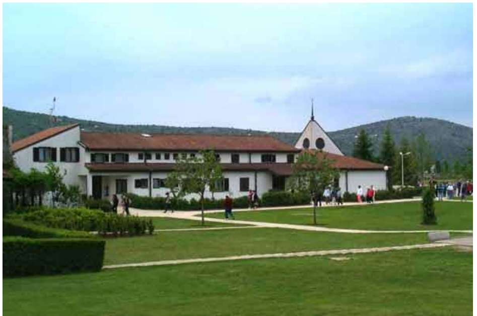
Kapelica Klanjanja u Međugorju

ja se mogu spasiti od ponora koji stoji ispod moga bitka. Gospodine, prihvaćam svoju ovisnost o tebi. Nastojat ću se osloboditi od svih idola što sam ih podigao na oltar svoga srca. I bit ću tvoj rob: rob Boga ljubitelja i osloboditelja! Ljubiti ću sve u tebi. Ništa i nikoga neću ljubiti neovisno o tebi. Bog moj, sve moje. Amen."