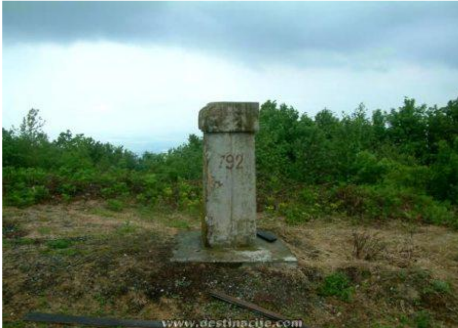
Vrh Kapovac, Duzluk, Papuk, Orahovica, 792 m

I kaza narodu, koji se okupi od Požege sve do Orahovice, naglašavaju i svaku izgovorenu riječ kako bi mogli uti i oni koji se još malo usput zadržase u gostioni uz pivu: