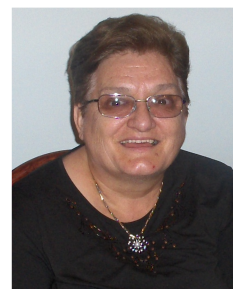
Pripremila: Marija Dragun rođj. Takši