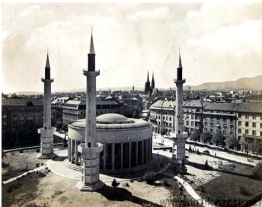
Džamija s minaretima