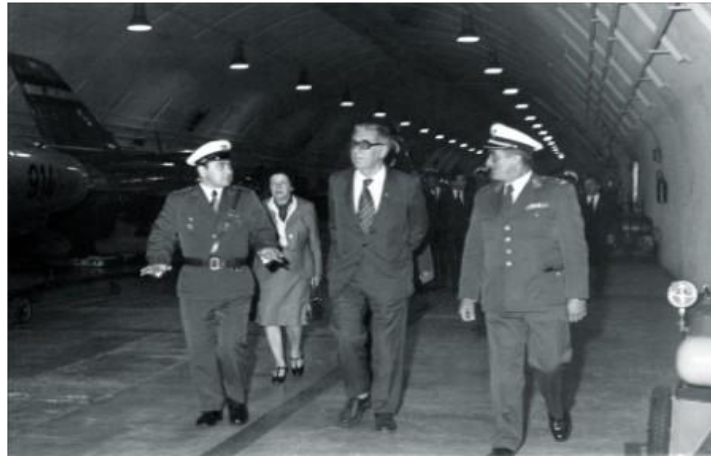
Milka Planinc i Jakov Blaževi