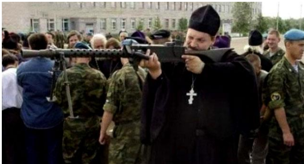
Srpska crkva u ratu i ratovi u njoj, Milorad Tomanić, Beograd 2020.