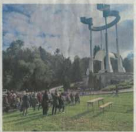
tudi vacuje pred hudožinski in kruti-timi dejani. Za tako sočutje v tistem času v teh krajih ni bilo mesta. Žal go-miti danes ni v zadostni meri, saj bi

Kljub temu se mnogi delajo, kakor da gre za drugorazreden, se pravi zama-zarjen stranski pojav slarne in zma-govite revolucije," je v pridigi poudaril Stres. "Kar nas vsako leto zbira tukaj na Teharjah - tako kot tudi na drugih mestih po naši domovini - je najprej sočutje. Sočutje je plemenito čustvo, ki nas povezuje z vsaki upostini in nas