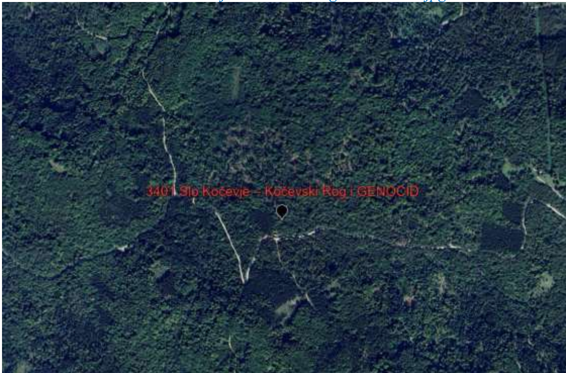
3401 Slo Kočevje – Kočevski Rog i GENOCID.jpg

U partizanima, da dokažete da ste im odani, morali ste ubiti nekog svog. To je sve opisano u knjizi “Svi umiru jednako”. Takve partizanske ubojice koji bi se poslije opijali i pričali o tome što su radili bili bi likvidirani. Na Bledu, u odmaralištu ( 3402 Slo Bled, koljači odmaraju ), bi se odmarali i dobivali nagrade za genocidno ubijanje. Prva nagrada je bila za onog koji je ubio najmanje 3 000 zarobljenika. “Pobjednička” partizanska vojska nije mogla imati ranjenike bez ruke ili noge -