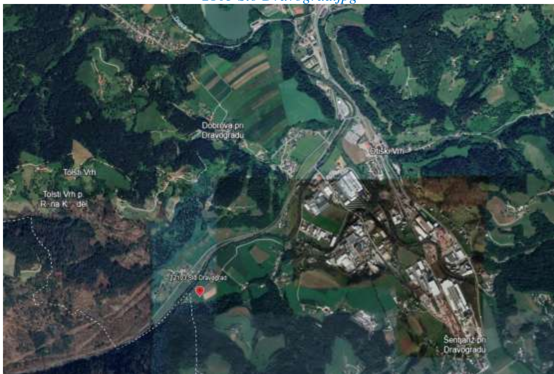
2103 Slo Dravograd.jpg

Nastavlja se (22. dio) strana 97. Na Bleiburgu