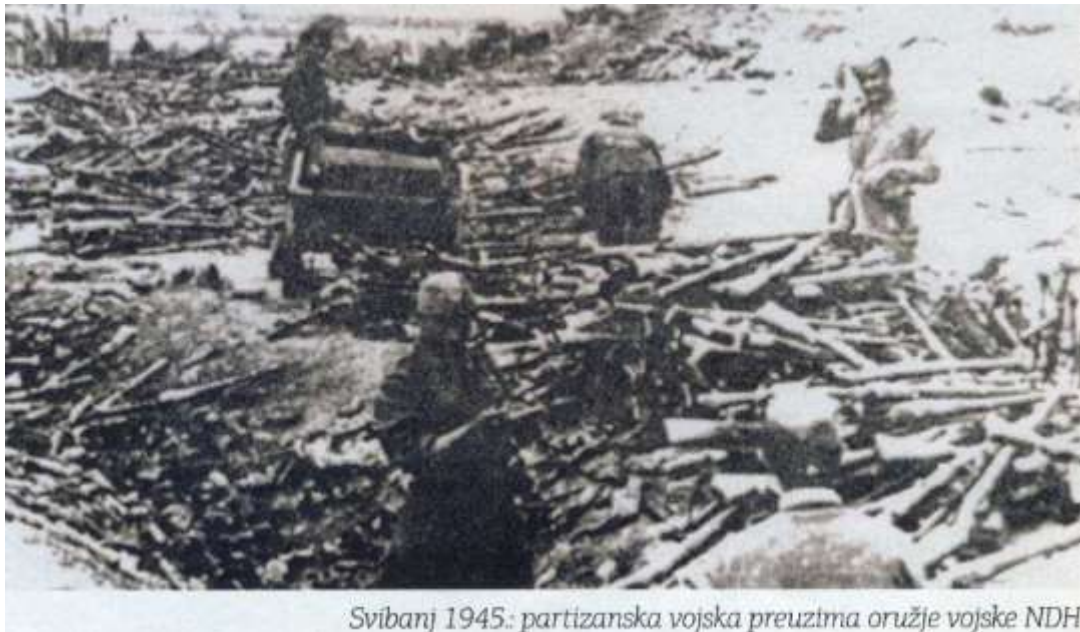
Svibanj 1945.: partizanska vojska preuzima oružje vojske NDH

Ni srozavanje nije bilo organizacijski, srozavao se svako za sebe. Nikakvog skupnog predavanja ili kapitulacije nije bilo. Barem se pred partizanima nije skupno pokleklo. Mnogi su se mlađji časnici i odvažniji borci sjetili tih trenutaka preporuke pukovnika Frane Sudara - jednog od pregovarača sa partizanima od prije dva dana - da se u manjim skupinama ide u šumu. Prisebniji su se razbježali po šumama. Bježati se je moglo, ali su potištenost i umor bili toliki, da su se samo prisebniji na to mogli odvažiti.